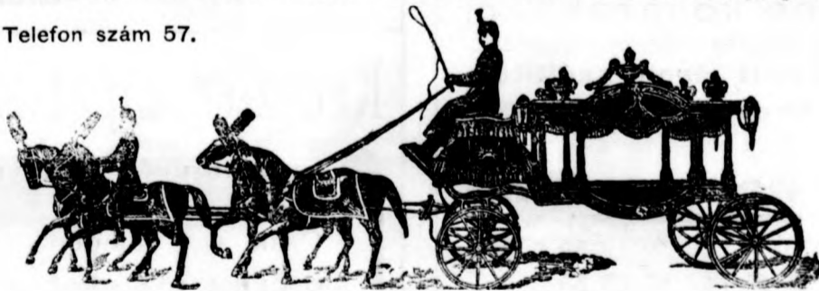
Diszes üveges gyászkocsi.

Mindenkor nagy választék sarkoszorokban, szalagokban igen jutányos áron.