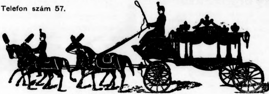
Diszes üveges gyászkocsi.

Mindenkor nagy választék sirkoszorokban, szalagokban igen jutányos áron.