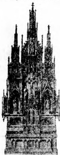
Nemetprónai templom főoltára 1907.

Oltárok, szószékek, keresztelő-kutak, szobrok és kereszt- úti állomások stb. izléses készítése. Régi oltárok átala- kítása és diszitése. Vázlatokat és költ- ségeloirányzatokat díjmentesen küldök. Polychromikus festészet! Mindennemű tárgyak minden alakban tiróli iparjelleg szerint.