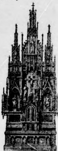
Németpérenál templom 1604-ára 1907.

Oltárok, szószekek, keresztelő-kutak, szobrok és kereszt-úti állomások stb. izléses készítése. Régi oltárok átalakítása és díszítése. Vázlatokat és költségelőirányzatokat díjmentesen küldök. Polychromikus festészet! Mindennemű tárgyak minden alakban tiroliparjelleg szerint.