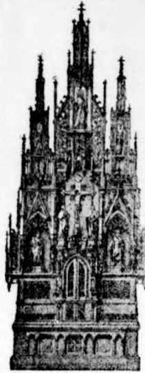
Németprónai templom főoltára 1907.

Oltárok, szószekek, keresztelő-kutak, szobrok és kereszt- úti állomások stb. izléses készítése.