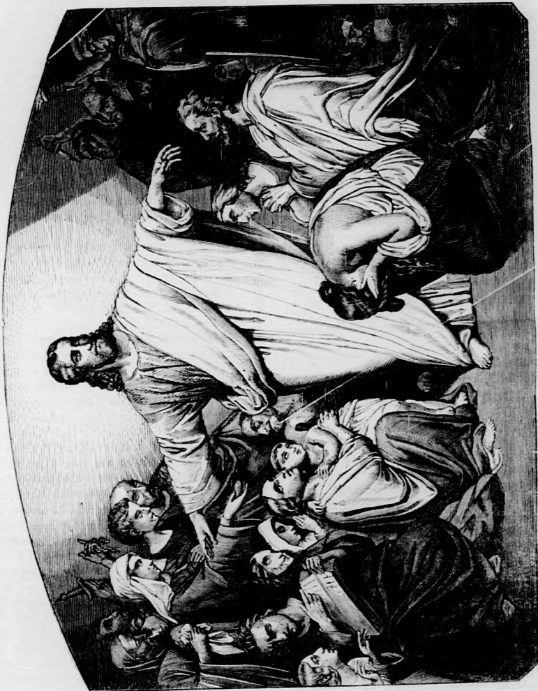
Jézus, az igaz bíró!