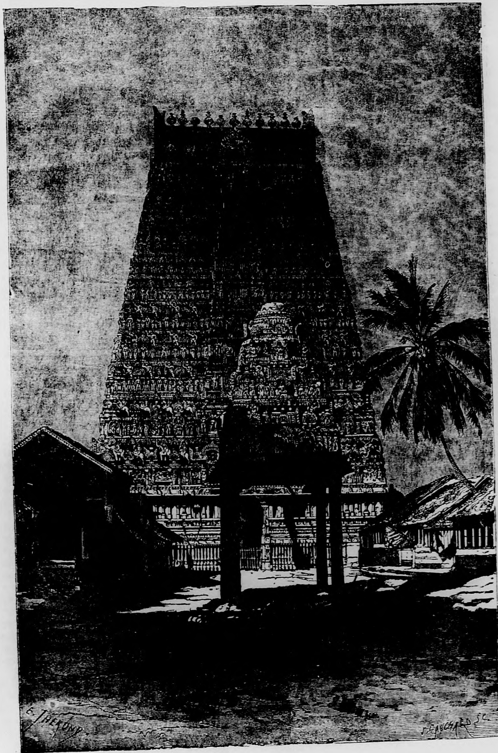
(A tüzimádók temploma Ázsiában. — L. Vegyések.)

őrség 7 kitiltott a városból, mert semmi jövedelmi forrást nem tudtam kimutatni. Ez eleinte nagyon nehezemre esett; de mikor a város hátam mögött volt, és Heim befolyását többé nem éreztem, lassankint gondolkodóba estem, s úgy tetszett, hogy talán jobb lenne rám nézve, ha Heimtől teljesen távol tartanám maga-