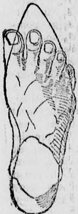
Rendes láb rossz formájú czipőben.

megtartja a láb természetes nemes alakját, úgy simul a lábhoz, mintha oda volna öntve és amellet kifogástalan eleganciájával és tartósságával tűnik ki.