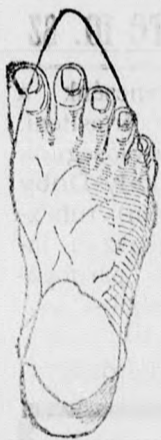
Rendes láb rossz formájú czipőben.

megtartja a láb természetes nemes alakját, úgy simul a lábhoz, mintha oda volna öntve és emellett kifogástalan eleganciájával és tartósságával tűnik ki.