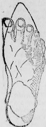
Rendes láb rossz formájú czipőben.

megtartja a láb természetes nemes alakját, úgy simul a lábhoz, mintha oda volna öntve és amellet kifogástalan eleganciájával és tartósságával tűnik ki.