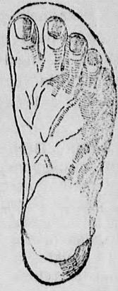
Rendseks láb. Chasalla czipőben

Egyedüli elárusító GUTTFREUND SAMU Kassa, Fő-u. 43.