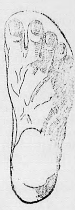
Rendseks láb. b Chasalla czipő

Egyedüli elárusító GUTTFREUND SAMU Kassa, Fő-u. 43.