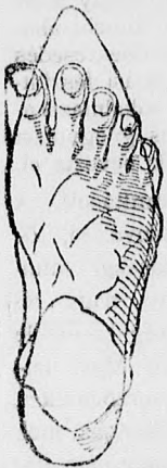
Rendes láb rossz formájú czipőben.

megtartja a láb természetes nemes alakját, úgy simul a lábhoz, mintha oda volna öntve és amellet kifogástalan eleganciájával és tartósságával tűnik ki.