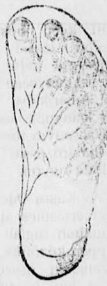
Rendesebb láb. Chasalla czipő.

Egyedüli elárusító GUTTFREUND SAMU Kassa, Fő-u. 43.