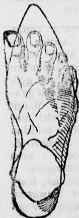
Rendes láb rossz formájú czipőben.

megtartja a láb természetes nemes alakját, úgy simul a lábhoz, mintha oda volna öntve és amellet kifogástalan eleganciájával és tartósságával tűnik ki.