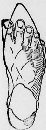
Rendes láb rossz formájú czipőben.

megtartja a láb természetes nemes alakját, úgy simul a lábhoz, mintha oda volna öntve és amellettf kifogástalan eleganciájával és tartósságával tűnik ki.