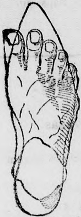
Rendes láb rossz formájú czipőben.

megtartja a láb természetes némes alakját, úgy simul a lábhoz, mintha oda volna öntve és amellet kifogástalan eleganciájával és artósságával tűnik ki.