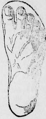
Rendes láb b. Chasalla czipők

Egyedüli elárusító GUTTFREUND SAMU Kassa, Fő-u. 43.