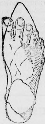
Rendes láb rossz formájú czipőben.

megtartja a láb természetes nemes alakját, úgy simul a lábhoz, mintha oda volna öntve és amellettf kifogástalan eleganciájával és artósságával tűnik ki.