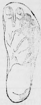
Rendes láb Chasalla czipők

Egyedüli elárusító GUTTFREUND SAMU Kassa, Fő-u. 43.