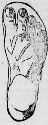
Rendes lább. Chasalla czipők

Egyedüli elárúsító GUTTFREUND SAMU Kassa, Fő-u. 43.