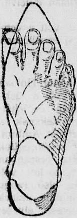
Rendes láb rossz formájú czipőben.

megtartja a láb természetes nemes alakját, úgy simul a lábhoz, mintha oda volna öntve és amellet kifogástalan eleganciájával és artósságával tűnik ki.