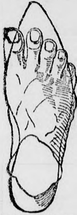
Rendes láb rossz formájú czipőben.

megtartja a láb természetes nemes alakját, úgy simul a lábhoz, mintha oda volna öntve és amellet kifogástalan eleganciájával és artósságával tűnik ki.