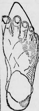
Rendes láb rossz formájú czipőben.

megtartja a láb természetes nemes alakját, úgy simul a lábhoz, mintha oda volna öntve és amellet kifogástalan eleganciájával és artósságával tűnikti.