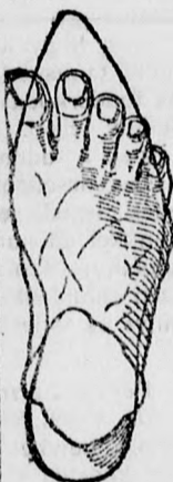
Rendes láb rossz formájú czipőben.

megtartja a láb természetes nemes alakját, úgy simul a lábhoz, mintha oda volna öntve és amellet kifogástalan eleganciájával és artósságával tűnik ki.