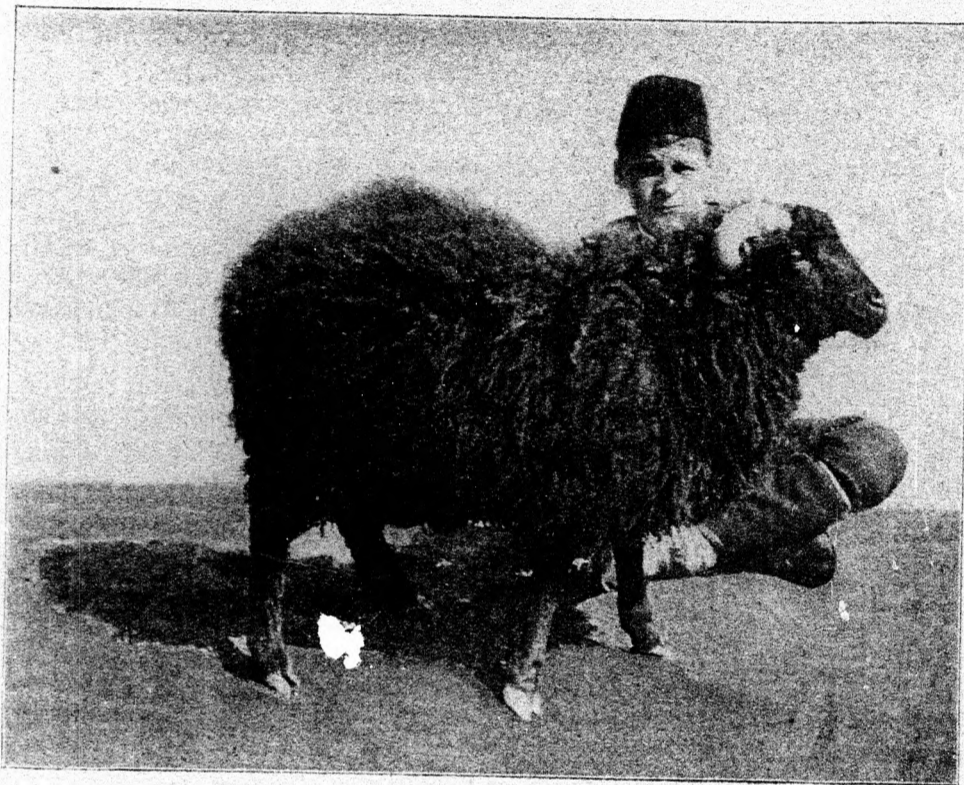
19. ábra. Telivér asztrakán kos

u. n. „horodenka” és a „kövérfarku” juh a legalkalmasabb.