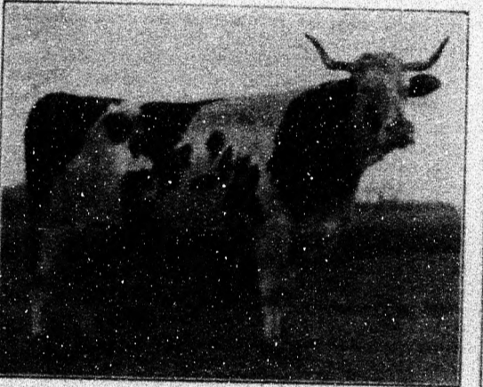
180. sz. kép. A mezőhegyesi m. kir. állami ménésbirtok „Juno 1627” nevű tevével szimmentáli tehene, Magyarország legjobb tejelő tehene az 1930. évben.