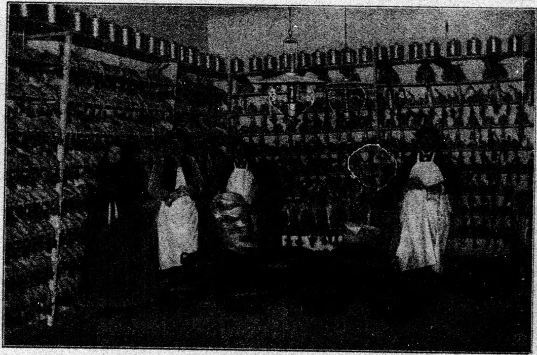
5. ábra. Baromfi-csomagoló-terem.