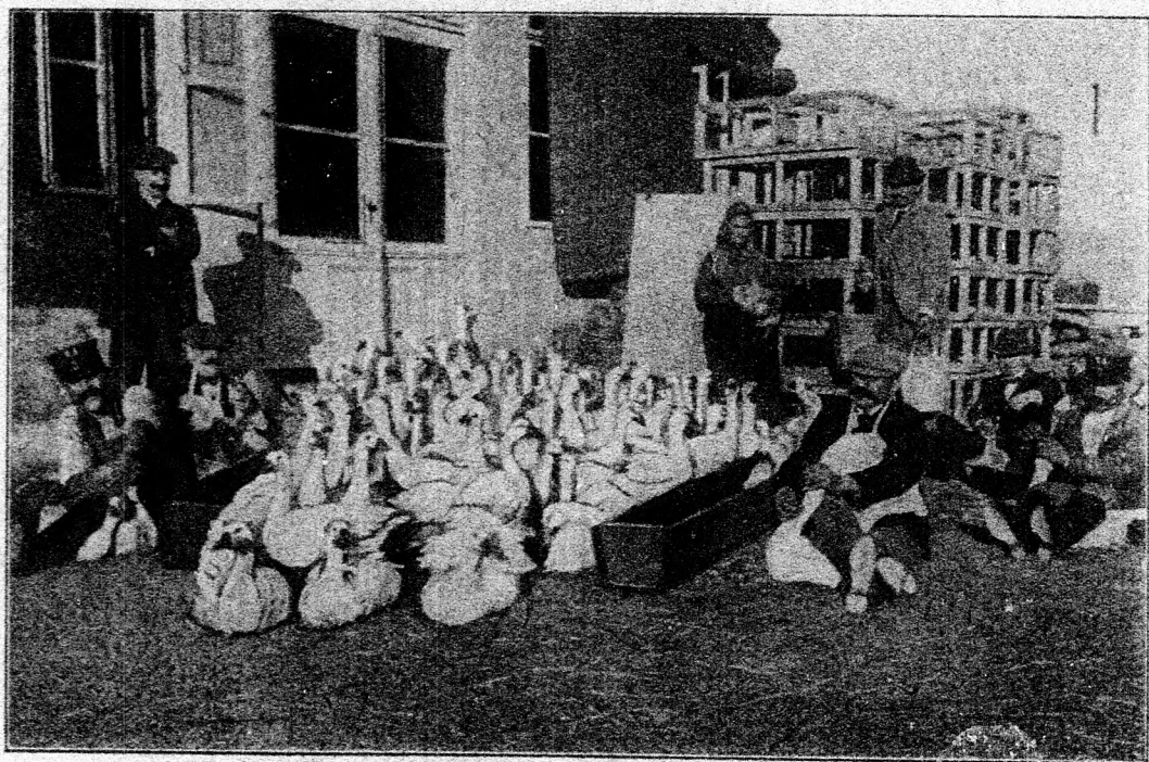
3. Ábra. Liba tömés.

vajjon kifizeti-e az magát? Szerfelett csodálkoznak azonban azon, ha a feltett kérdésekre csakis fentartással s bizonyos körülmények tekintetbe vételével hallják az „igent”.