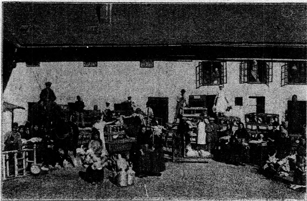
2. Ábra. Baromfi osztályozás.