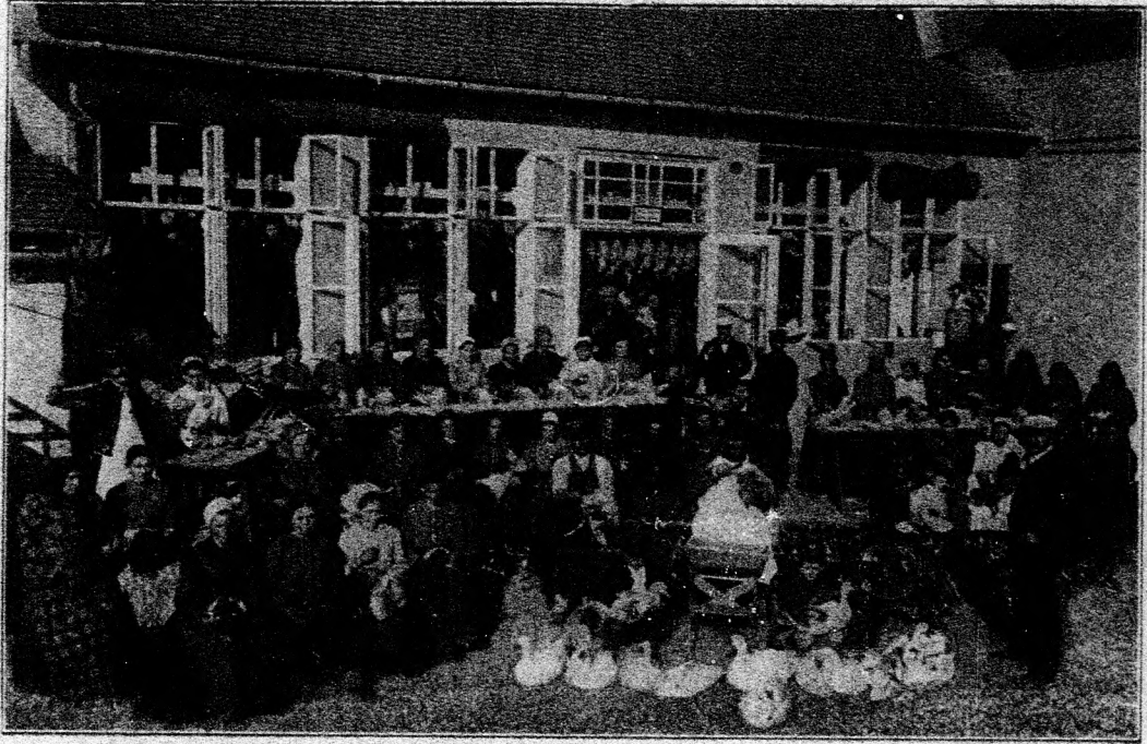
4. ábra. Koppasztó-terem.

A sok költőgép között sok van olyan, mely a baromfitenyésztő kezében ugyszólván teljesen hasznavehetetlen. Ha valaki költőgép- pel költetni óhajt, nagyon kell vigyáznia nehogy értéktelen s hasznavehetetlen gépet vegyen; s kiadott pénzéhez fáradságához még a bosszu- ság is járuljon.