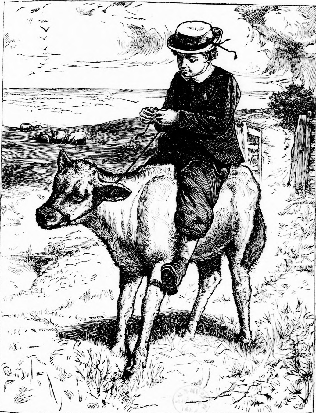
FURCSA LOVAG. (lásd 251. l.)