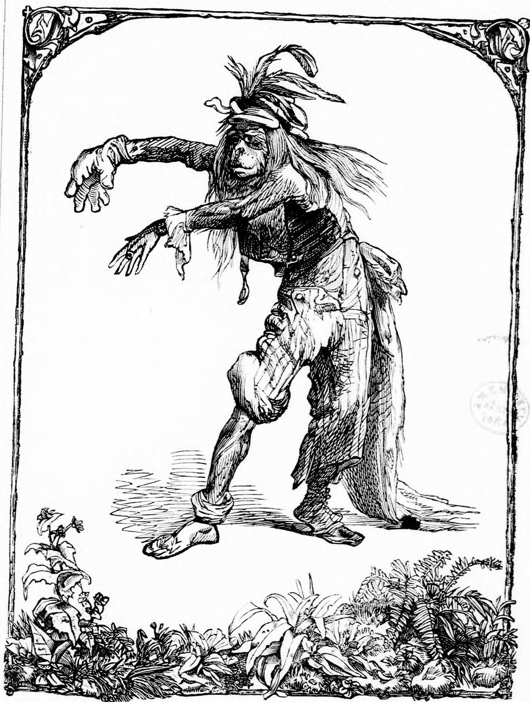
A TUDÓS MAJOM. (lásd 251. l.)