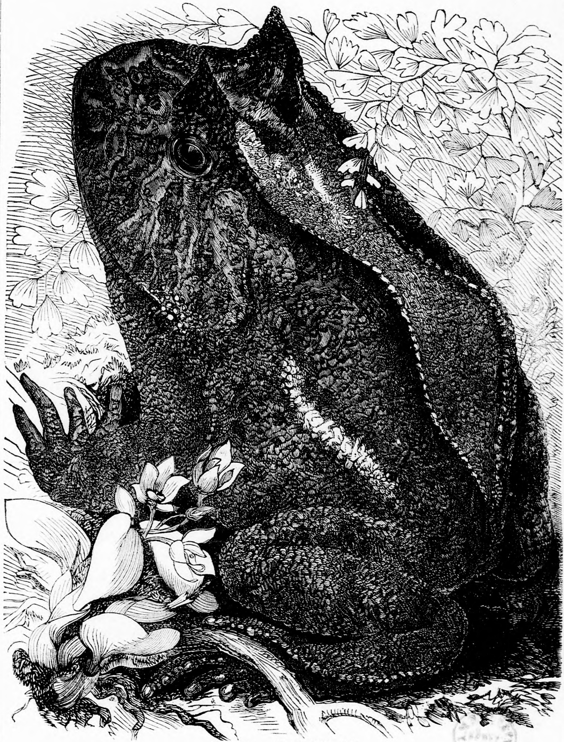
A BÉKA. (lásd 270. l.)