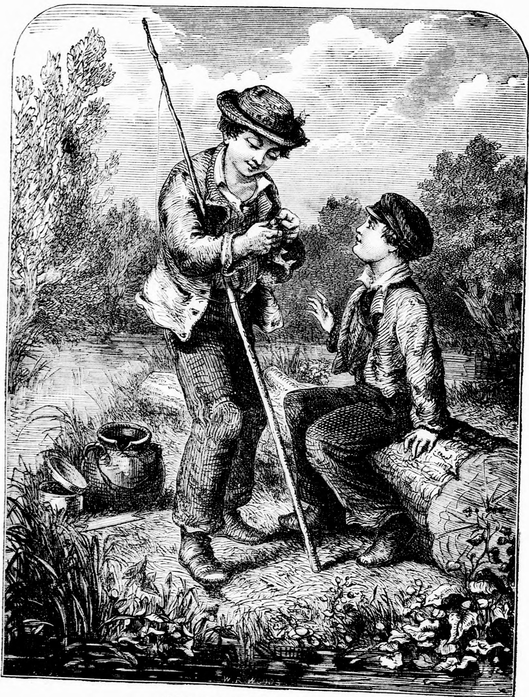
MEGFOGTAM! (lásd 271. l.)