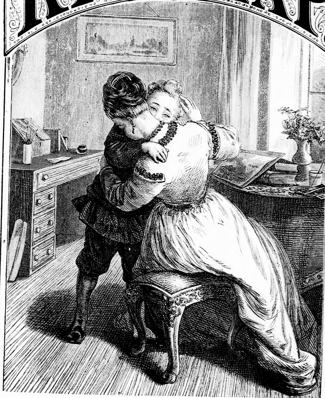
MAMA, TITKOT SUGOK. (lásd 271. l.)