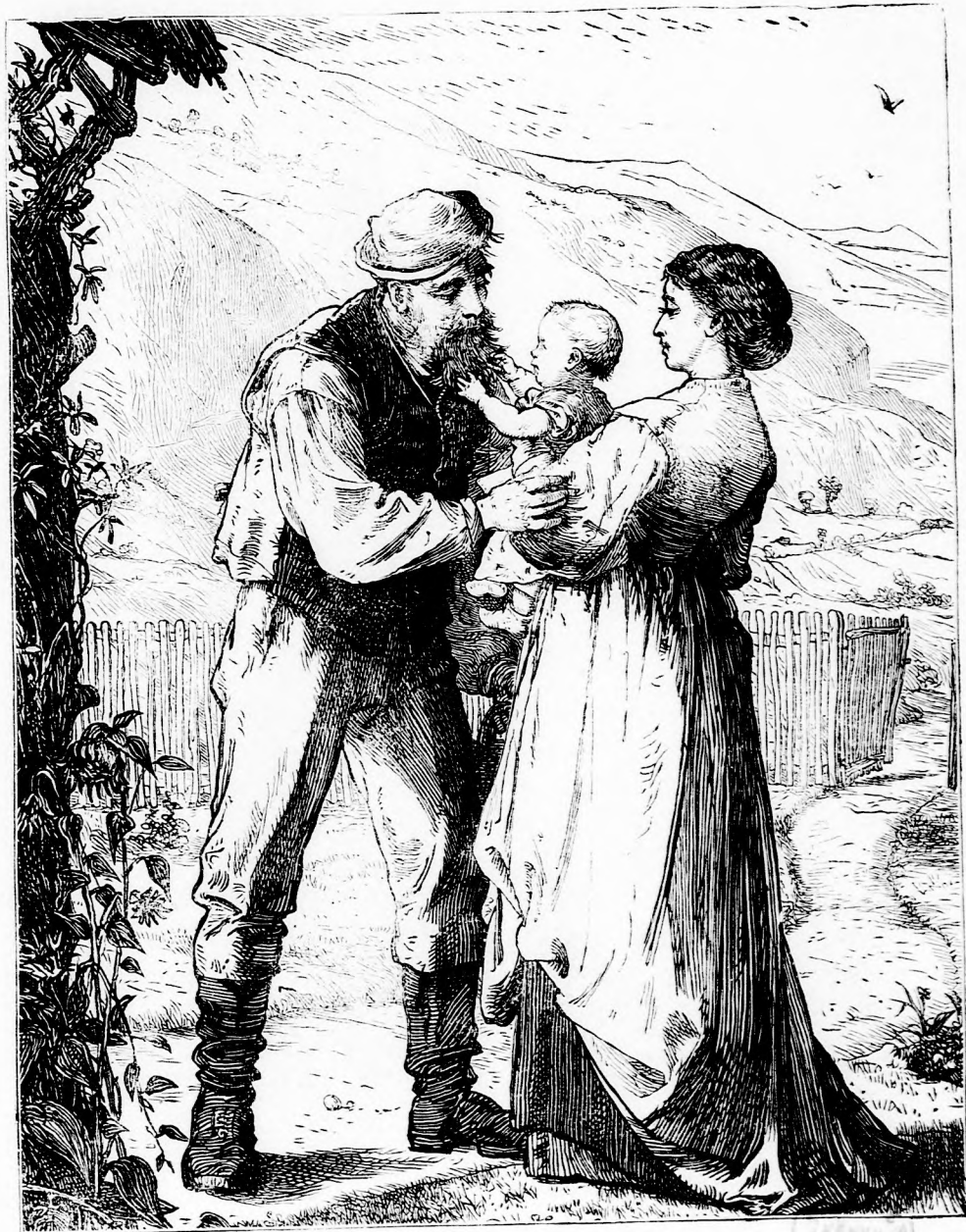
A MUNKÁS GYERMEKE. (lásd 413. l.)