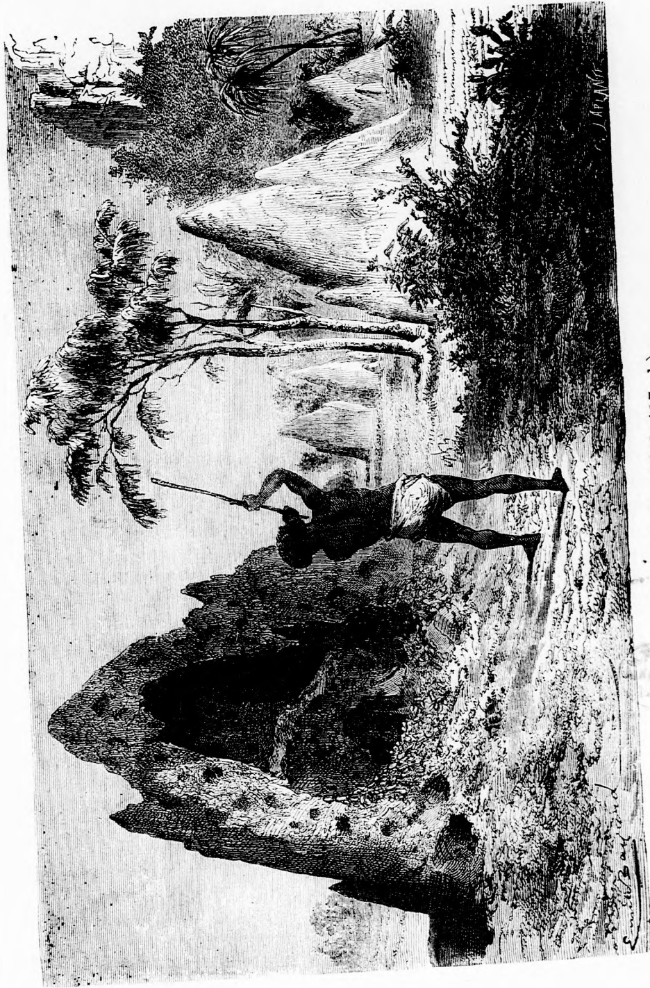
A TERMITÁK. (lásd 407. l.)