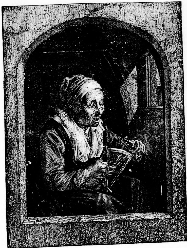
ERZSÓK NÉNI. (lásd 407. l.)

A kezébe adjuk — Jöszte hamar, apjuk. Csitt, csitt Mi az itt? Ottan jó egy ember A szakála kender. Nagyokat lép egyre