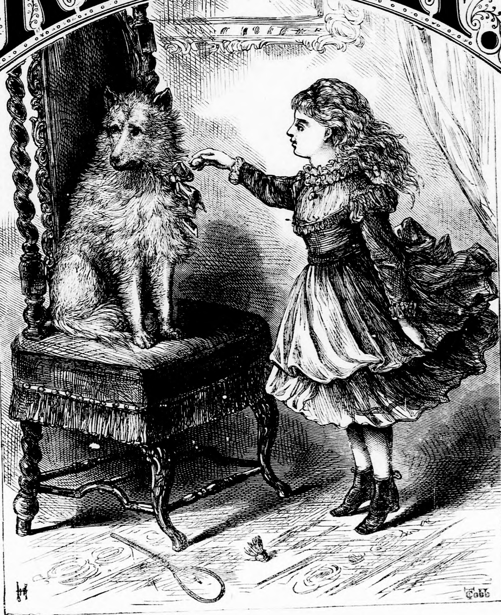
A BURKUS HARAGSZIK. (lásd 410. l.)

utolsó. Lesz benne jeles magyar író a olvasható, másik -ki hirdetés és föl- n. FORGÓ BÁCSI.