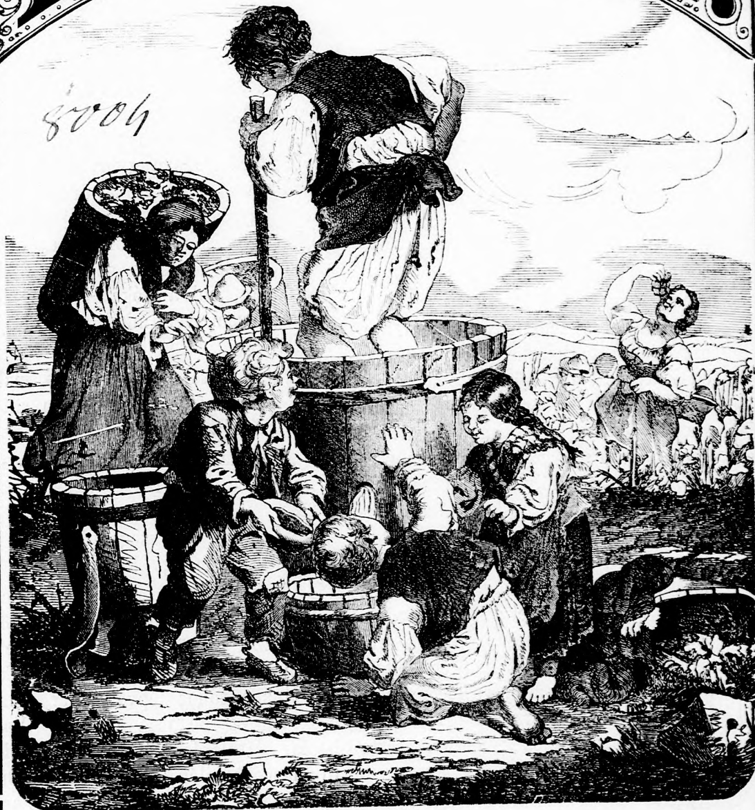
SZÜRETKOR. (lásd 7. 1.)