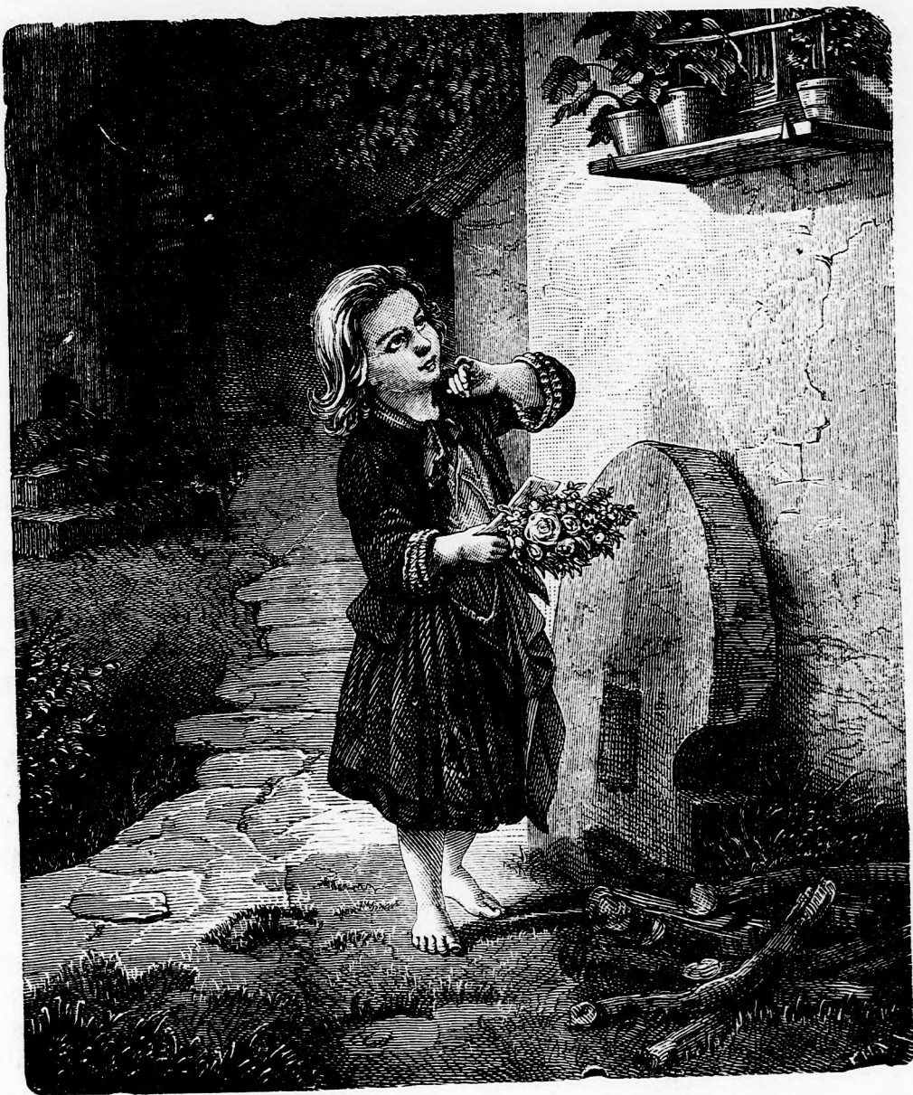
NAGYMAMA SZÜLETÉS-NAPJÁN. (lásd 11. l.)