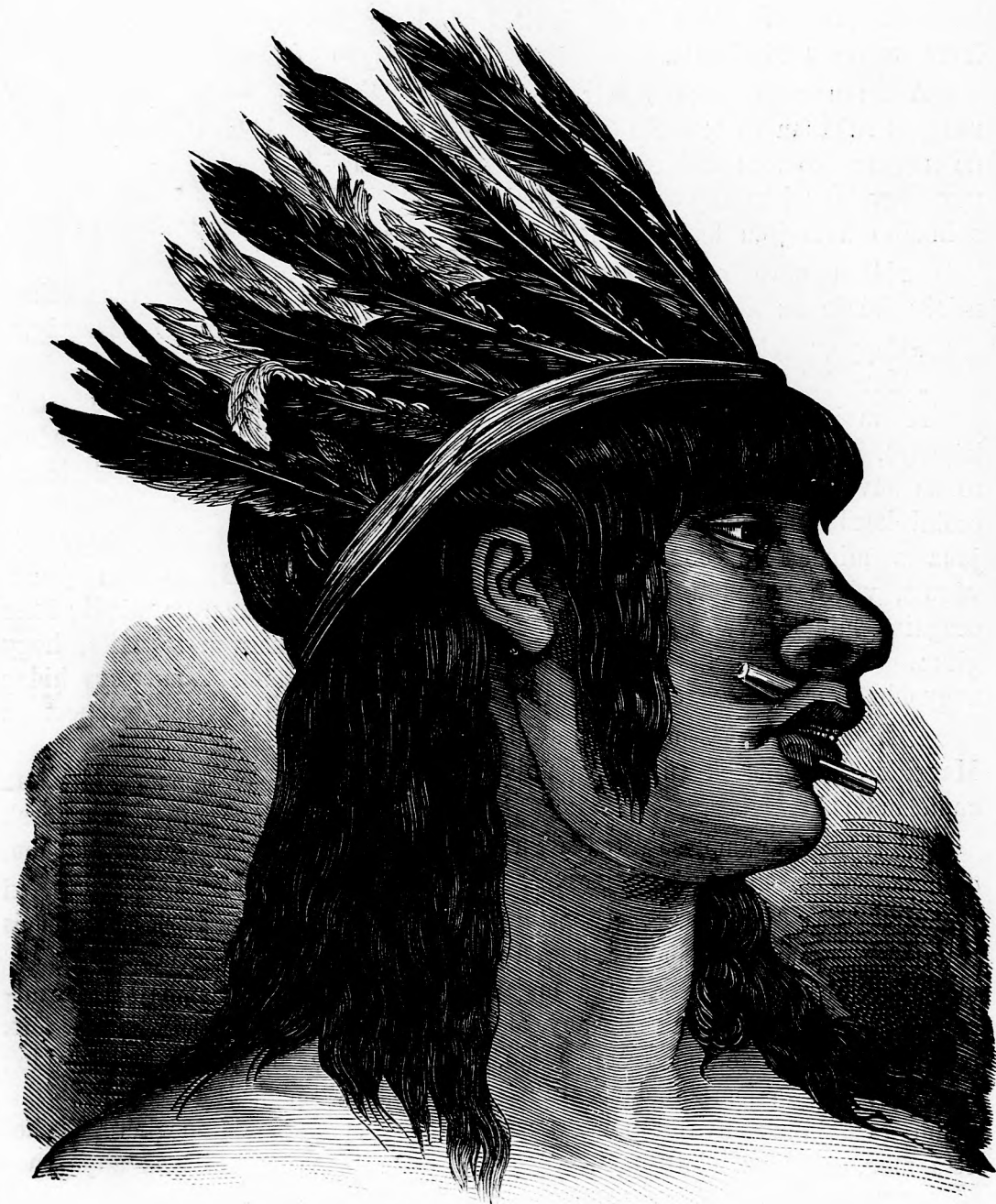
TÖRZSÉNEK LEGSZEBB FIA.

Kiadott és nyomatott a Deutsch-féle könyvnyomda és kiadói részv.-társ. intézetében, Pest Józseftér 6. sz.