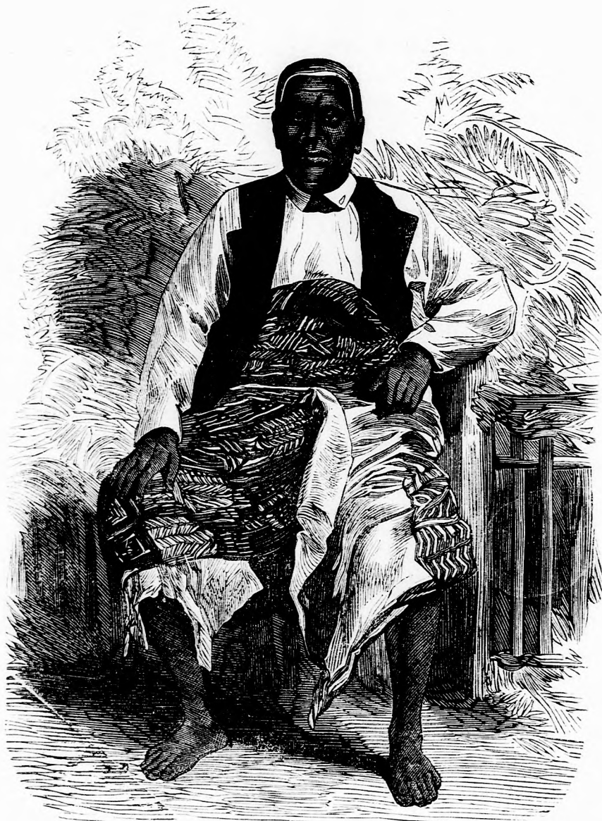
A FIDZSEK KIRÁLYA. (lásd 14. l)