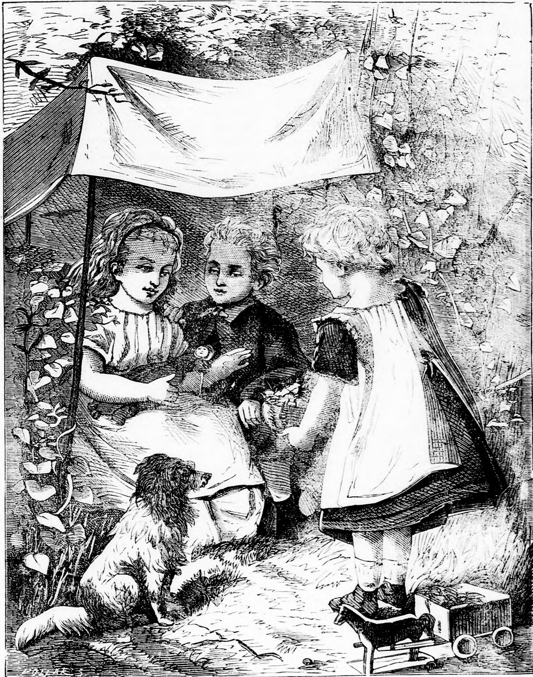
A VAK FIU. (lásd 71. l.)