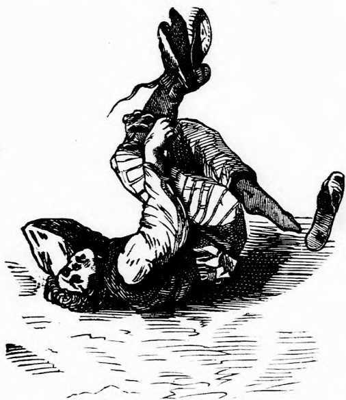
„Végre sikerült !“

Alig várta, hogy fölpróbálja. Hozzá is fogott rögtön, de mindjárt látta, hogy talán bizony kissé szorosak ; „majd kitágul, gondolá s csak huzta, huzta, hogy szintén bele-