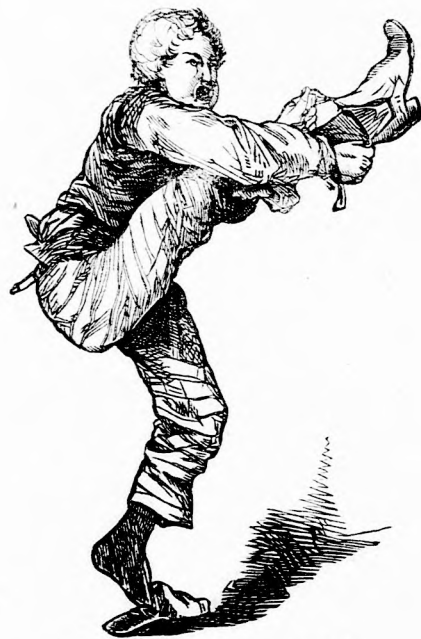
„Így tan jobban megy!”