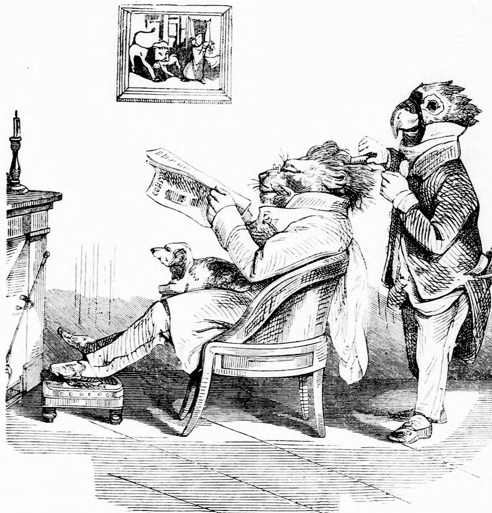
AZ OROSZLÁN MINT ARSZLÁN. (lásd 71. l.)