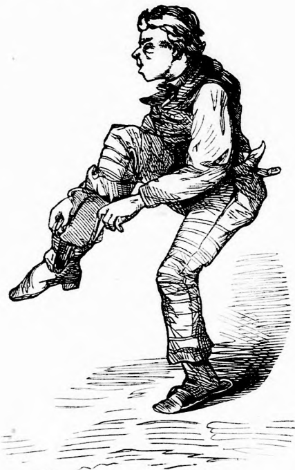
„No, bujjunk bele!”