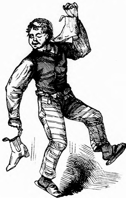
„Van szép cipőm!”