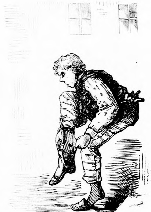
„Jaj, szűk a cipő!”