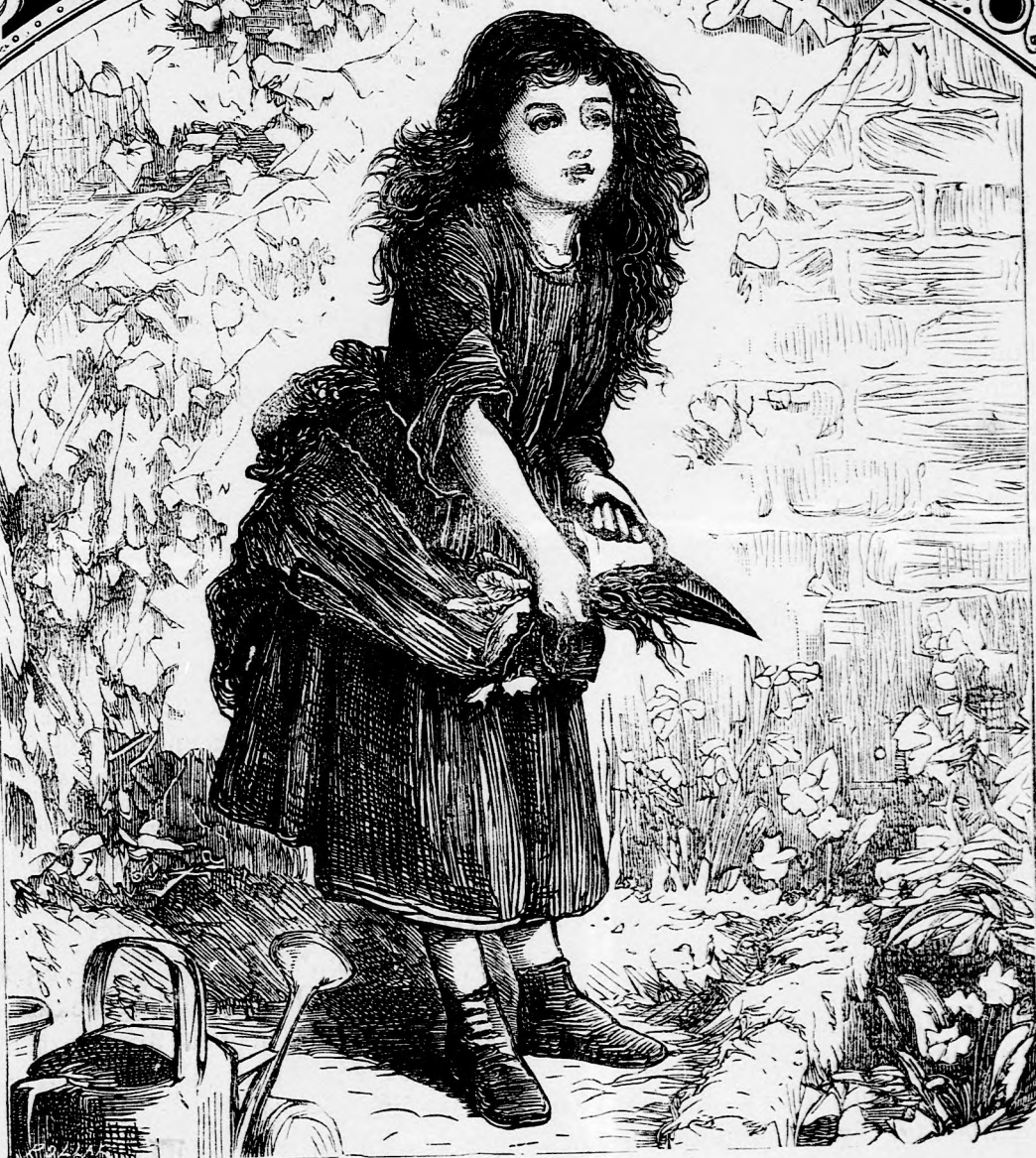
A KIS KERTÉSZ. (lásd 78. l.)