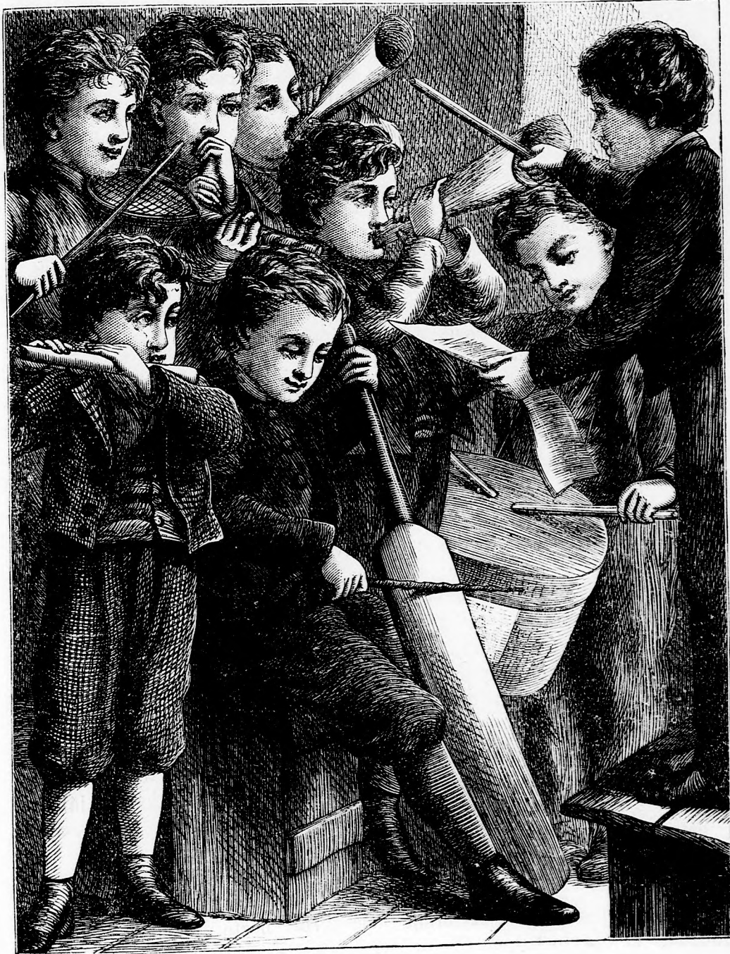
A KIS ZENEKAR. (lásd 191. l.)