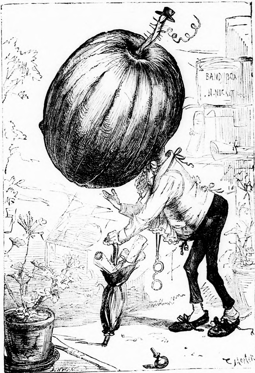
A TUDÓS TÖRKEJ. (lásd 186. l.)