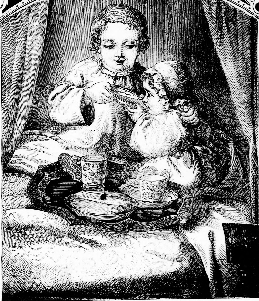
REGGELI AZ ÁGYBAN. (lásd 191. l.)