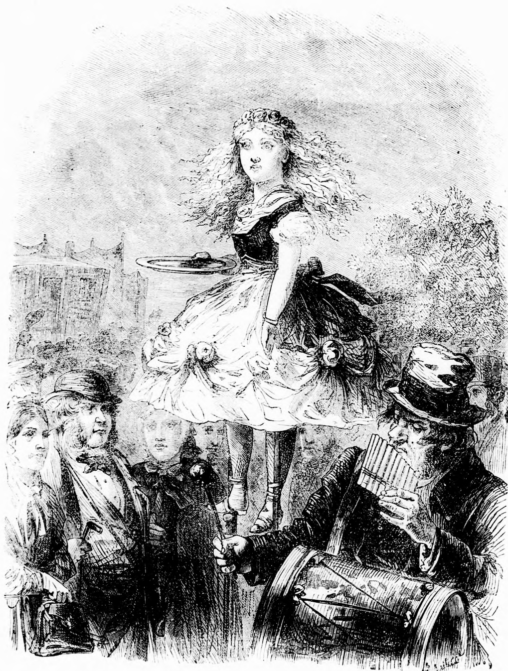
A Kis Tündér. (lásd 186. l.)