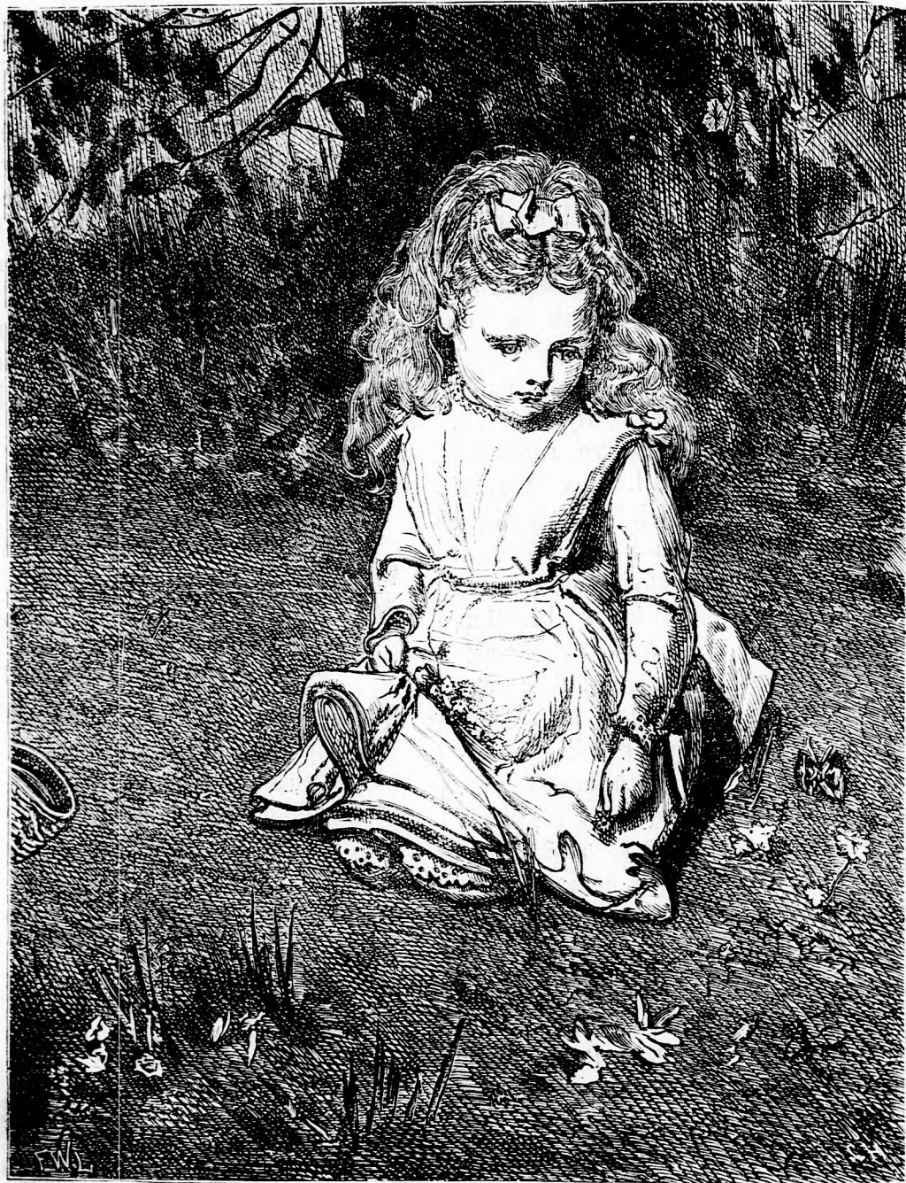
AZ ELSŐ BÁNAT. (lásd 359. l.)