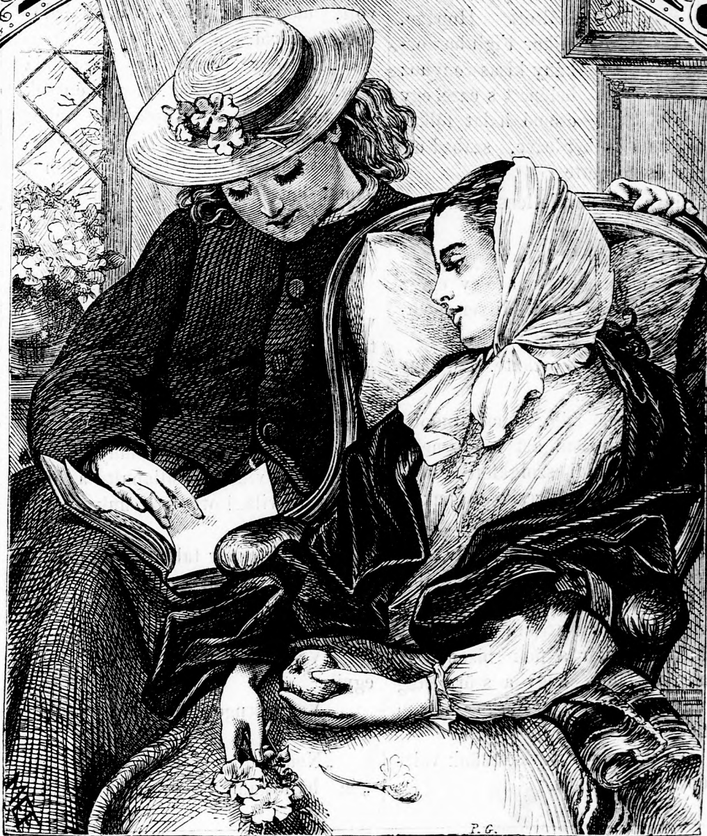
ÜDÜLÉS. (lásd 364. l.)