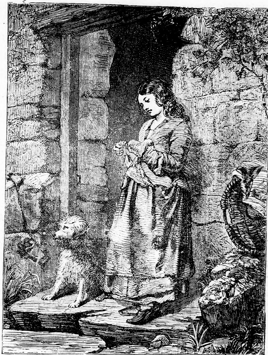
LACZIKA HARISNYÁI. (lásd 362. l.)