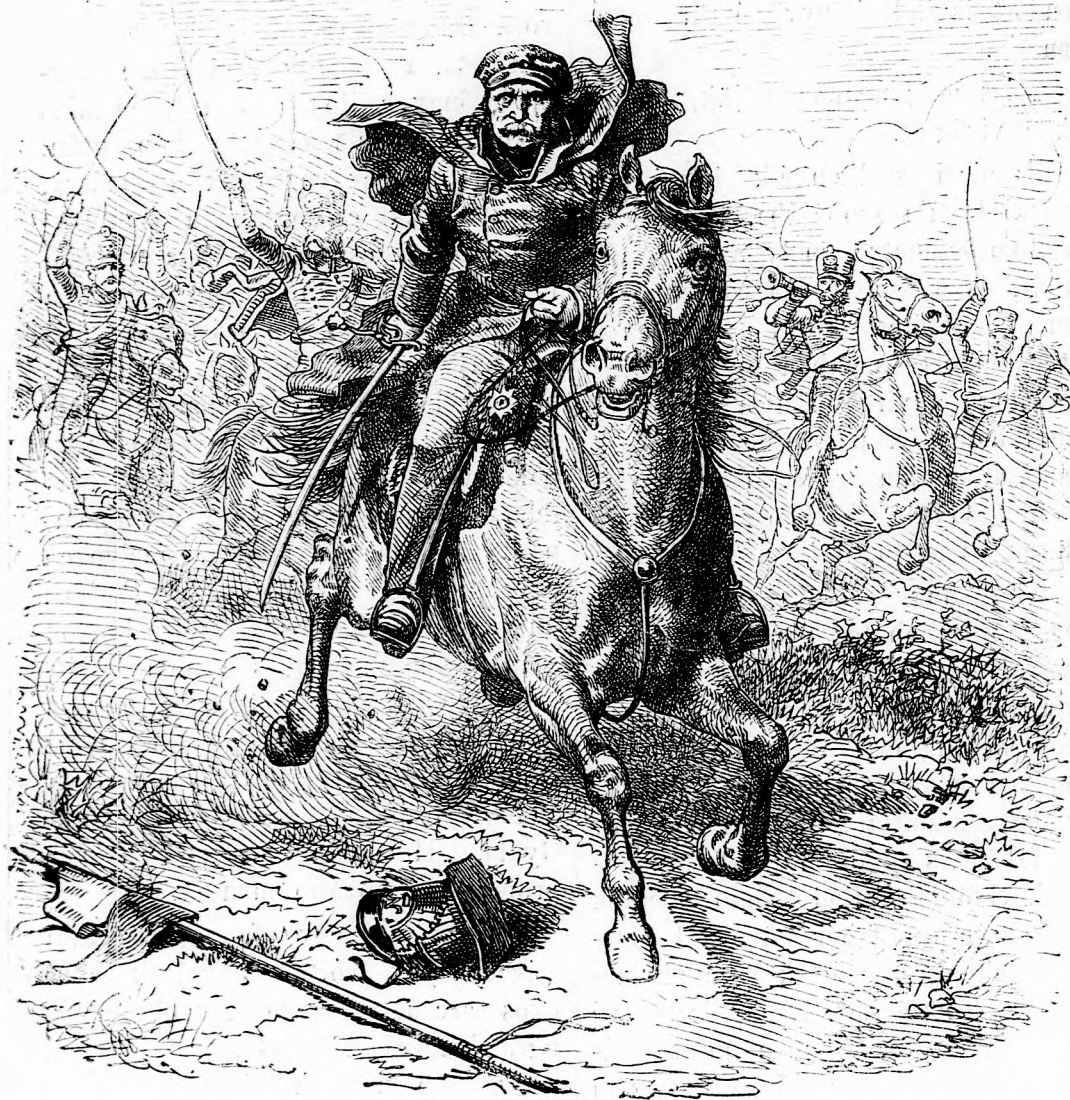
HUSZÁROK. (lásd 363. 1.)

Pest-bécsi irodalmi és művészeti intézet Deutsch testvérek. Felelős szerkesztő: Forgó bácsi. Ára negyedévre 1 frt.