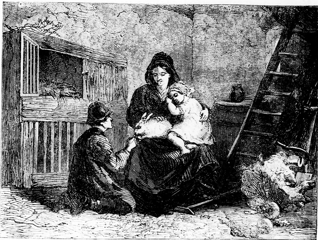
JULISKA ÉS A NYULACSKA. (lásd 362. 1)