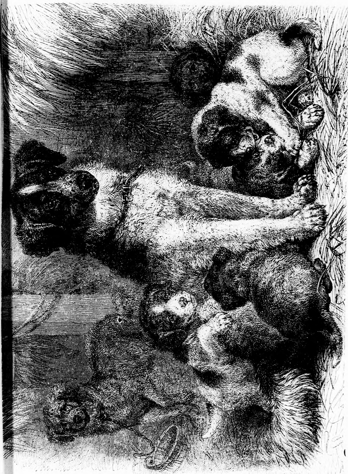
KUTYA-Család. (lásd 142. l.)