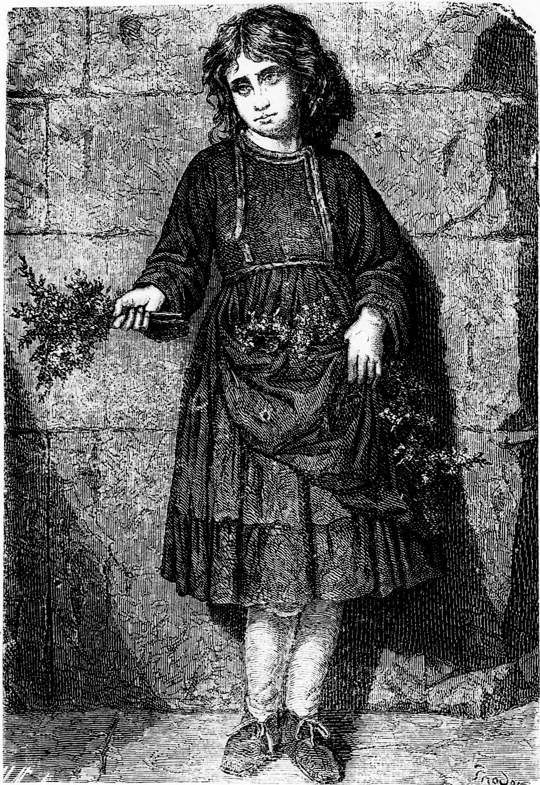
„VEGYETEK VIRÁGOT!“ (lásd 143. l.)

Pest-bécsi irodalmi és művészeti intézet Deutsch testvérek. Felelős szerkesztő: Forgó bácsi. Ára negyedévre 1 frt.