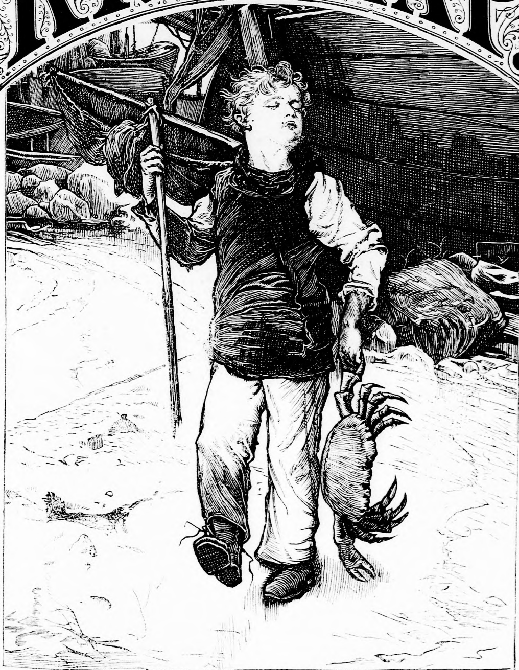
MAGYAR Tengerészfiu. (lásd 139. l.)