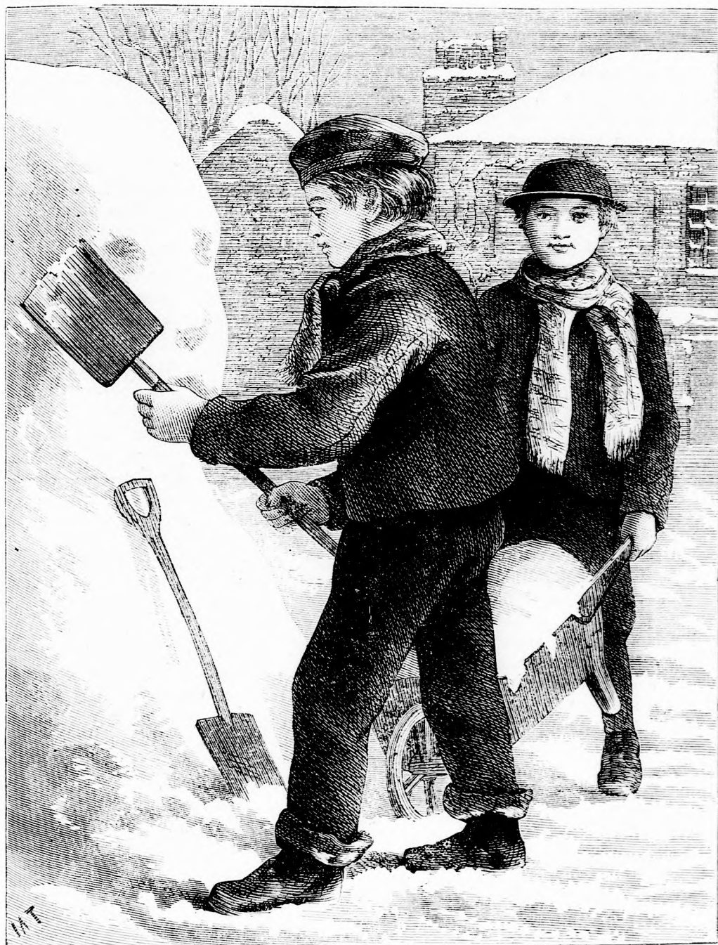
"... S BETÉRTEK EGY PAJTÁSUK UDVARÁBA, HOL ÉPEN HÓBABA CSINÁLÁSÁBAN FÁRADOZOTT KÉT TÁRSUK." (1881 138. 1.)