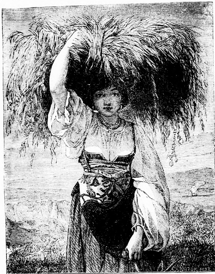
LEÁNY A CAMPAGNÁBÓL (lásd 142. l.)

szólt a fátyolos nő; „ott már mindenki alszik és miattatok nem kel föl; hanem majd én haza vezetlek, nem hagylak el, ne féljete. Jőjjetek