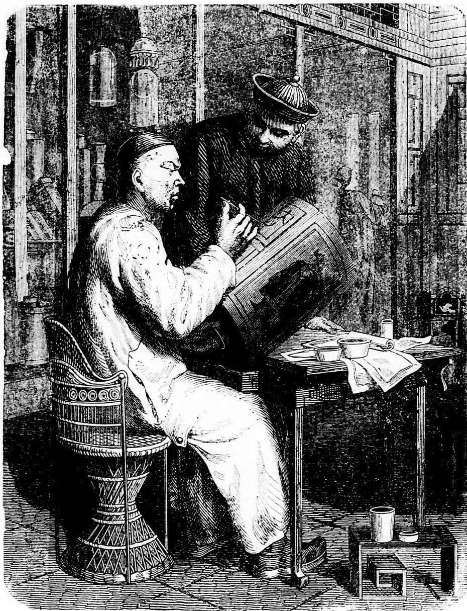
KINAI LÁMPAFESTŐ. (lásd 142. 1.)