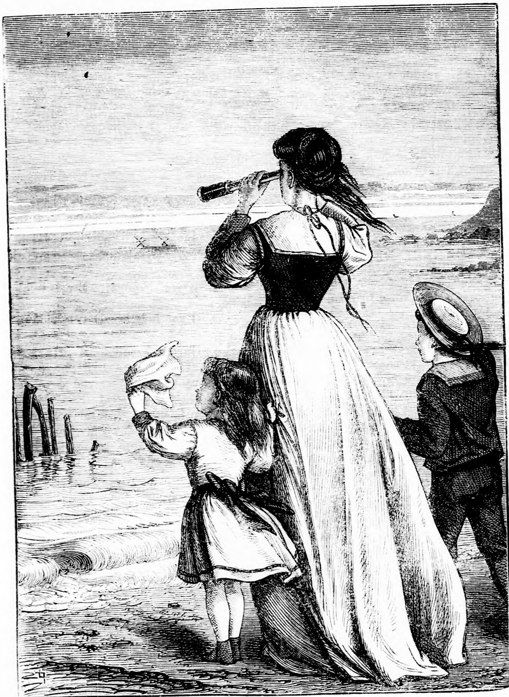
SZÜNIDŐBEN. (lásd a 366. l.)

Pest-bécsi irodalmi és művészeti intézet Deutsch testvérek. Felelős szerkesztő: Forgó bácsi. Ára negyedévre 1 frt.