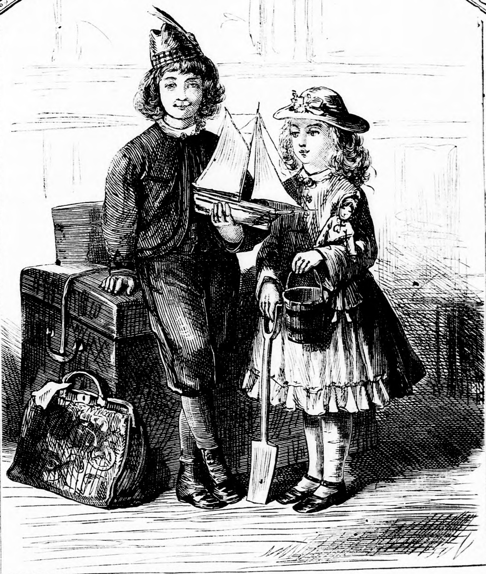
SZÜN-DIŐBEN. (lásd 366. l.)