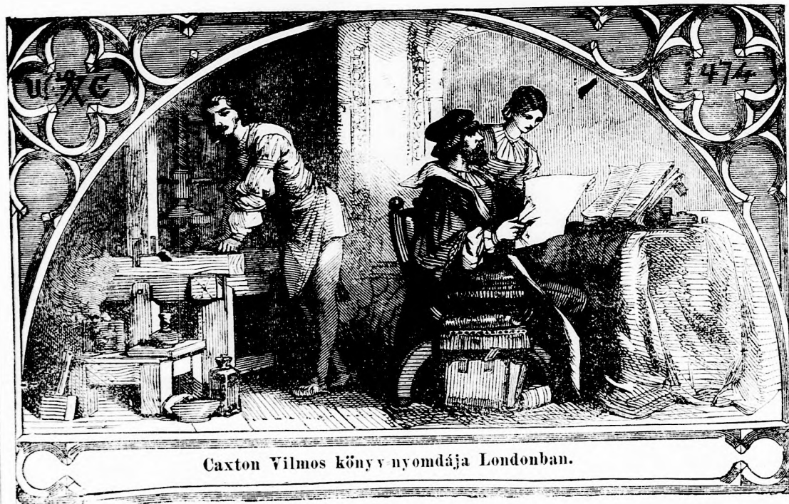
Caxton Vilmos könyv nyomdája Londonban.

Ugyanebben a könyvben többek közt olvasunk egy kis történetet, melyet befejezéséig ide írunk s mely a sakk-játék föltalálásáról szól. A kis történet így hangzik: