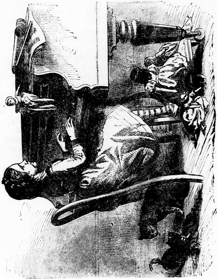
ZONGORA MELETT (Lásd a 394. l.)

parja s nem törődik többé vele, hanem a nap melegére bizza, hogy kiköltse; a strucz a madarak közt a