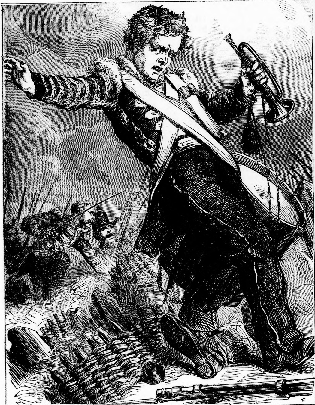
A VITÉZ TROMBITÁS. (Lásd a 399. l.)

Pest-bécsi irodalmi és művészeti intézet Deutsch testvérek. Felelős szerkesztő: Forgó bácsi. Ara negyedévre 1 frt.