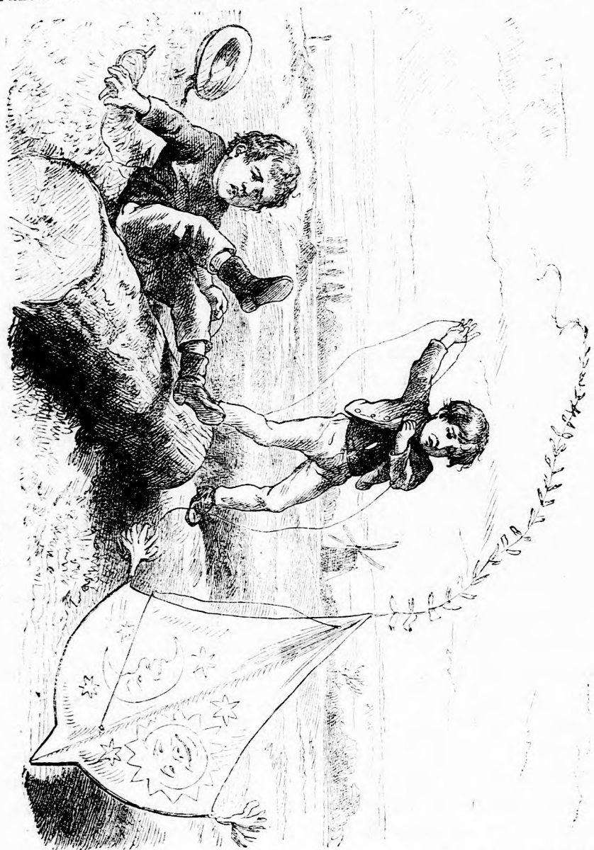
A PAPIR-SÁRKÁNY. (Lásd a 338. l.)

mert ez volt az egyedüli madár, melyet Jehovának áldozni szoktak volt. A galambot egyuttal a béke és sze-