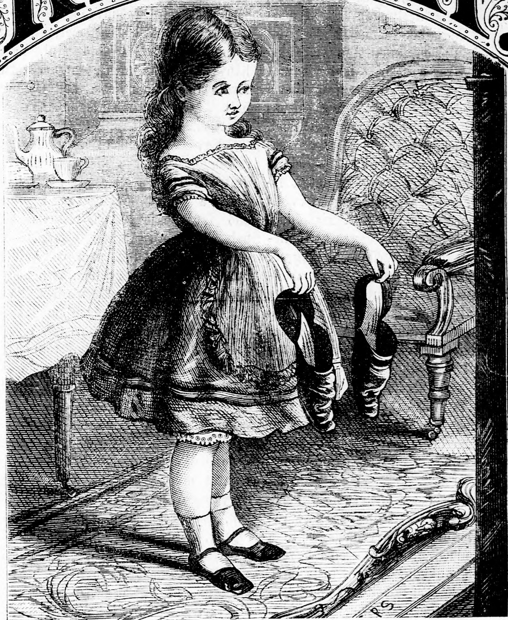
NAGYAPÓ PAPUCA. (Lásd a 390. l.)