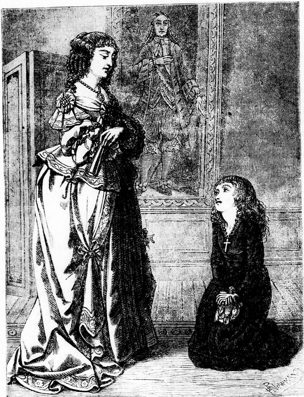
A KIS KATALIN KÖNYÖRGÉSE. (Lásd a 390. l.)