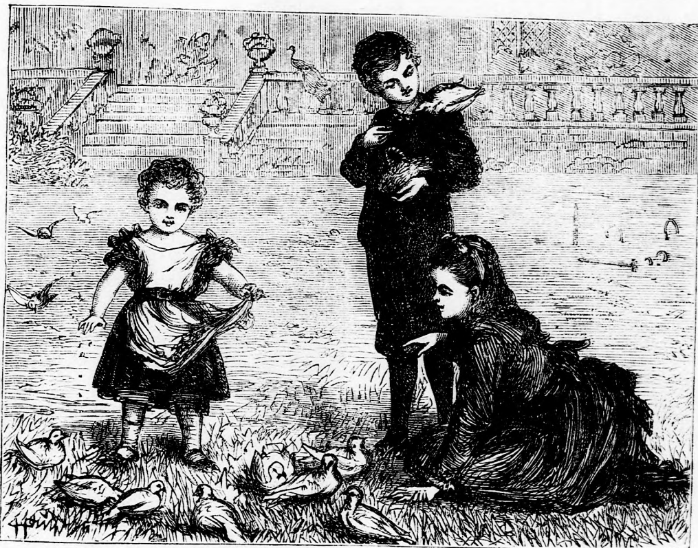
GALAMB-ETETÉS. (Lásd a 399. l.)

„Atyám! mi lelt?“ kiáltott fel Amarca hercegnő. Mindenki eltátotta száját a királyra, kinek nagy fülei nőt- tek, és orra kézzelfogható hosszura nyult. Az egész udvarnak nagyranőtt