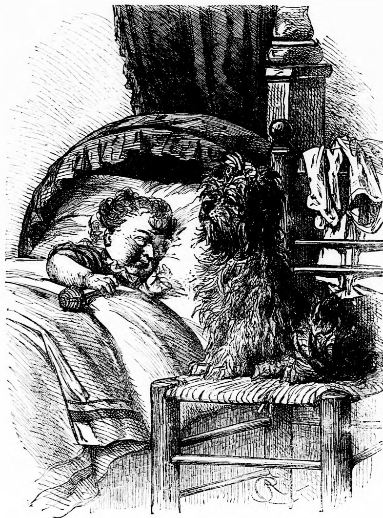
A HÜ ŐR. (Lásd a 62. l.)

„Köszönöm, uram!“ felelt Aladár halk hangon.