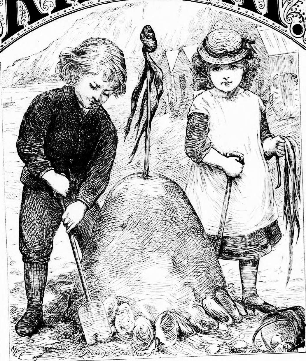
A VESZEKEDŐ TESTVÉREK. (Lásd az 54. l.)