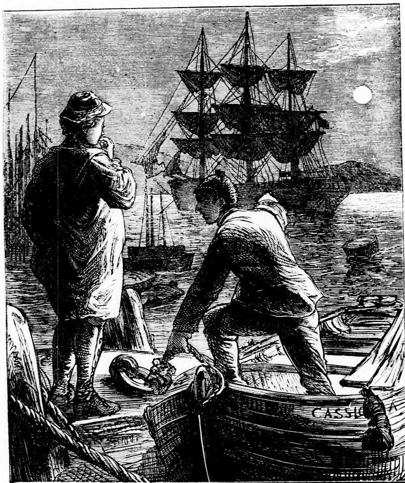
Peti tündök magában: menni vagy nem menni? (Lásd 51. l.)

legkel sokba a gy zony mint azon enge lideb kosko a m genn nyája kiván az ö rülbe hang rikai gyon szer léss tudn orsz Ohi épe zott fölk vas a mé