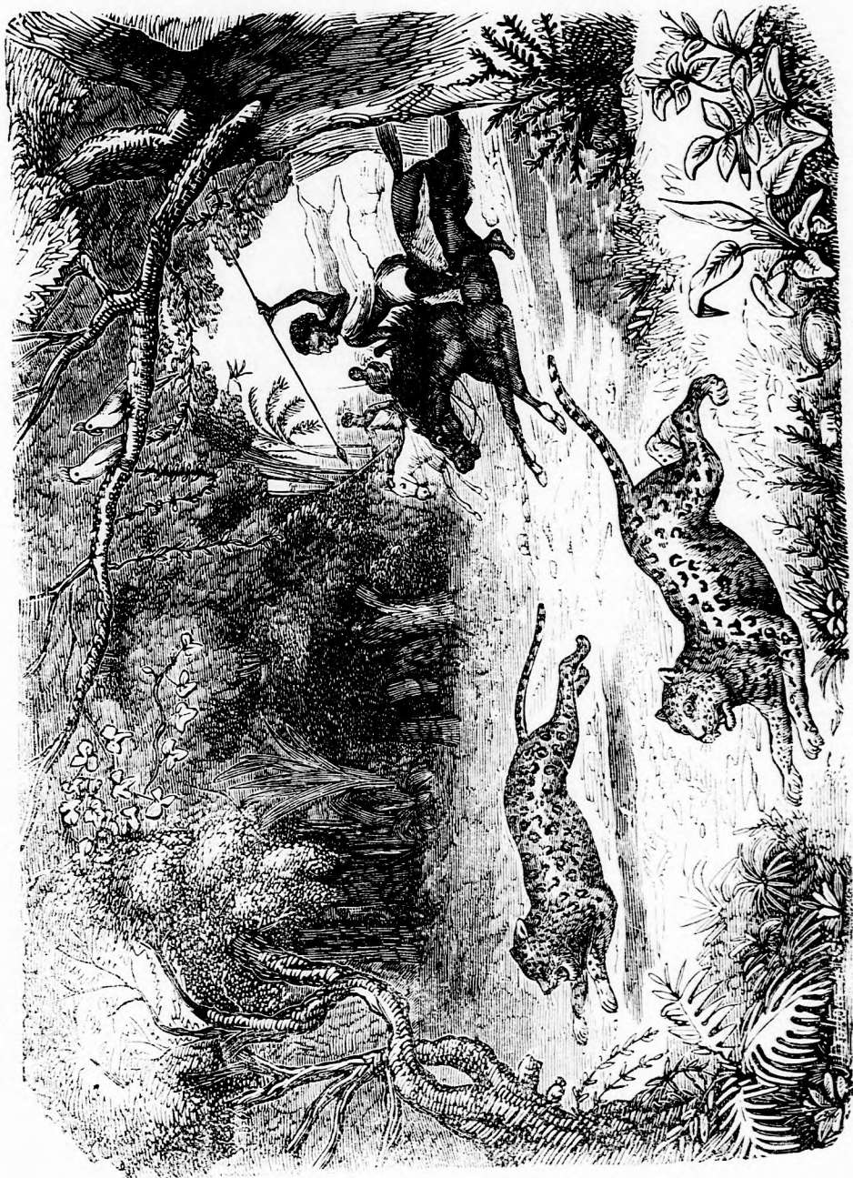
PÁRDUZVADÁSZAT, ÁBYSSINIÁBAN. (Lásd a 62. l.)