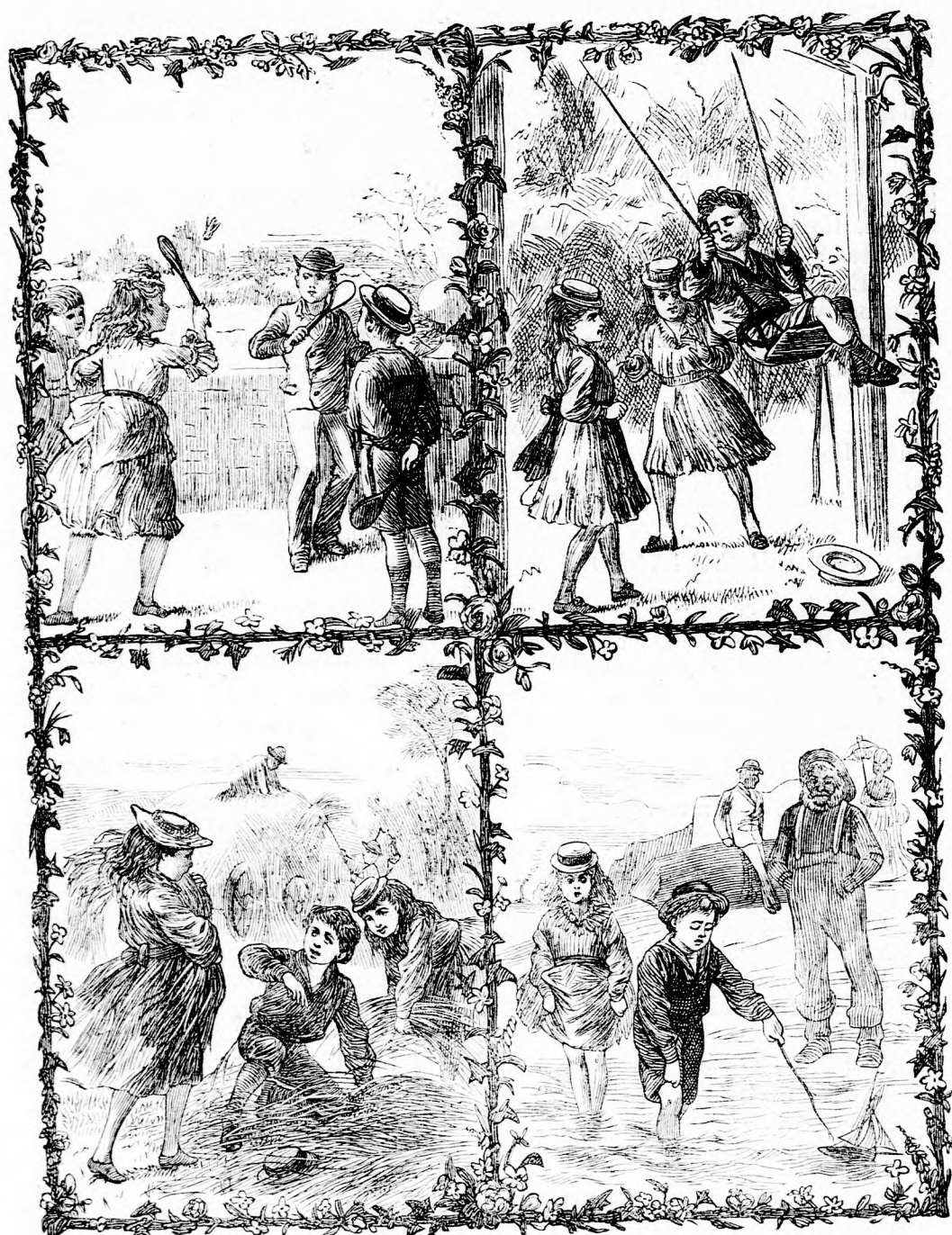
KÜLÖNFÉLE JÁTÉKOK. (Lásd a 78. l.)

Pest-bécsi irodalmi és művészeti intézet Deutsch testvérek. Felelős szerkesztő: Forgó bácsi . Ára negyedévre 1 frt.