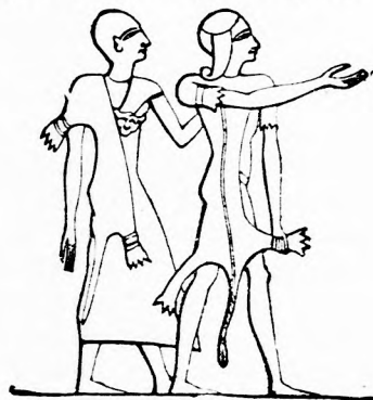
Párduczbőrös papok. (Régi egyiptomi rajz.)

A házak keleten nem oly szépek, mint a mi városainkban. A földszinti szobák az udvarra nyílnak, hol platanfák és ugrócutak enyhítik a levegő forróságát. A szobákban kevés butor van, a falak fehérre meszelvek, a föld puha szőnyegekkel van fedve s a falak körül is puha pamlagok vannak elhelyezve, melyeken aztán a férfiak órahcsszat hevernek és pipázgatnak. A ház egy részét „hárem“-nek nevezik és ebben csupán a nők laknak; a gazdagabb muzulmánok nejeinek és leányainak nem szabad az utcán járni; a kis leányok semmit sem tanulnak, még csak imádkozni, vagy olvasni, varrni sem; reggeltől estig csak hevernek és ásítognak. Nemde, rettentően unalmas lehet az? Nektek, kis olvasóim, ezerszerte jobb dolgok van s reményem, hogy meg is tudjátok becsülni.