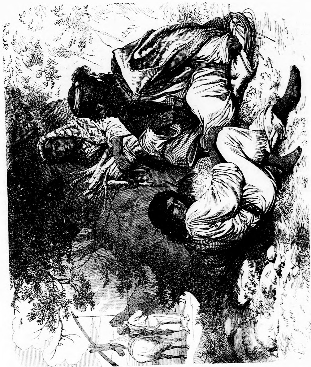
VÁNDOR CZIGÁNYOK. (Lásd a 79. l.)

A mint így fölváltva egy-egy pontot elfoglalnak, arra kell mindegyiknek igyekezni, hogy egy sorban három pontot