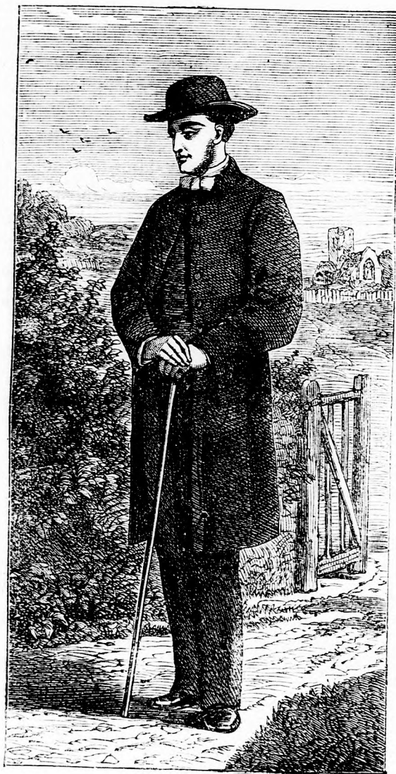
„Furcsa, furcsa!“ (Lásd 72. l.)

mialatt kísétált a mezőre; „és én ezt a derék állatot bántani akartam! Ki hitte volna, hogy még egy liba is megleckéztetheti az embert!“