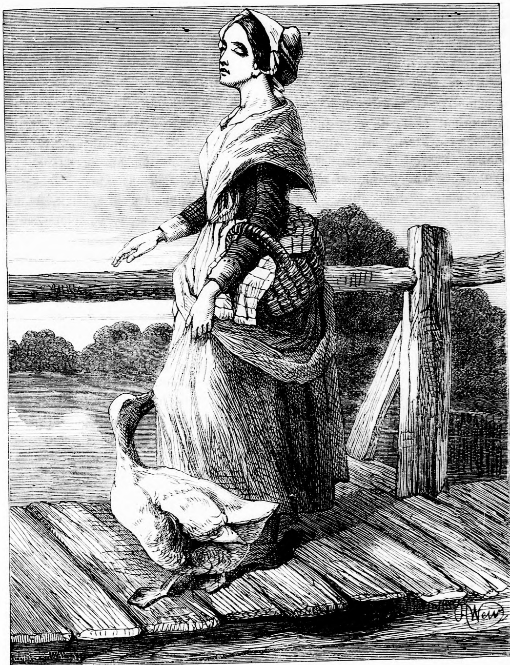
A TEMPLOMBA JÁRÓ LIBA. (Lásd a 70 l.)

valami zem, kö- .“ i, mert ő l,miután ismerem zet,“ fe- apitány. rmányos aggo- kalauz- ez maga vallotta, eki nem a dolog, tudja yarázni. n na- szel já- zátony- yzé meg nyos. ehogy!“ kalauz, zon uton a hajót, ár száz ezettem engerre. lehet té- t van a örhajó. száz öl- lságban adni és hogy kormá-