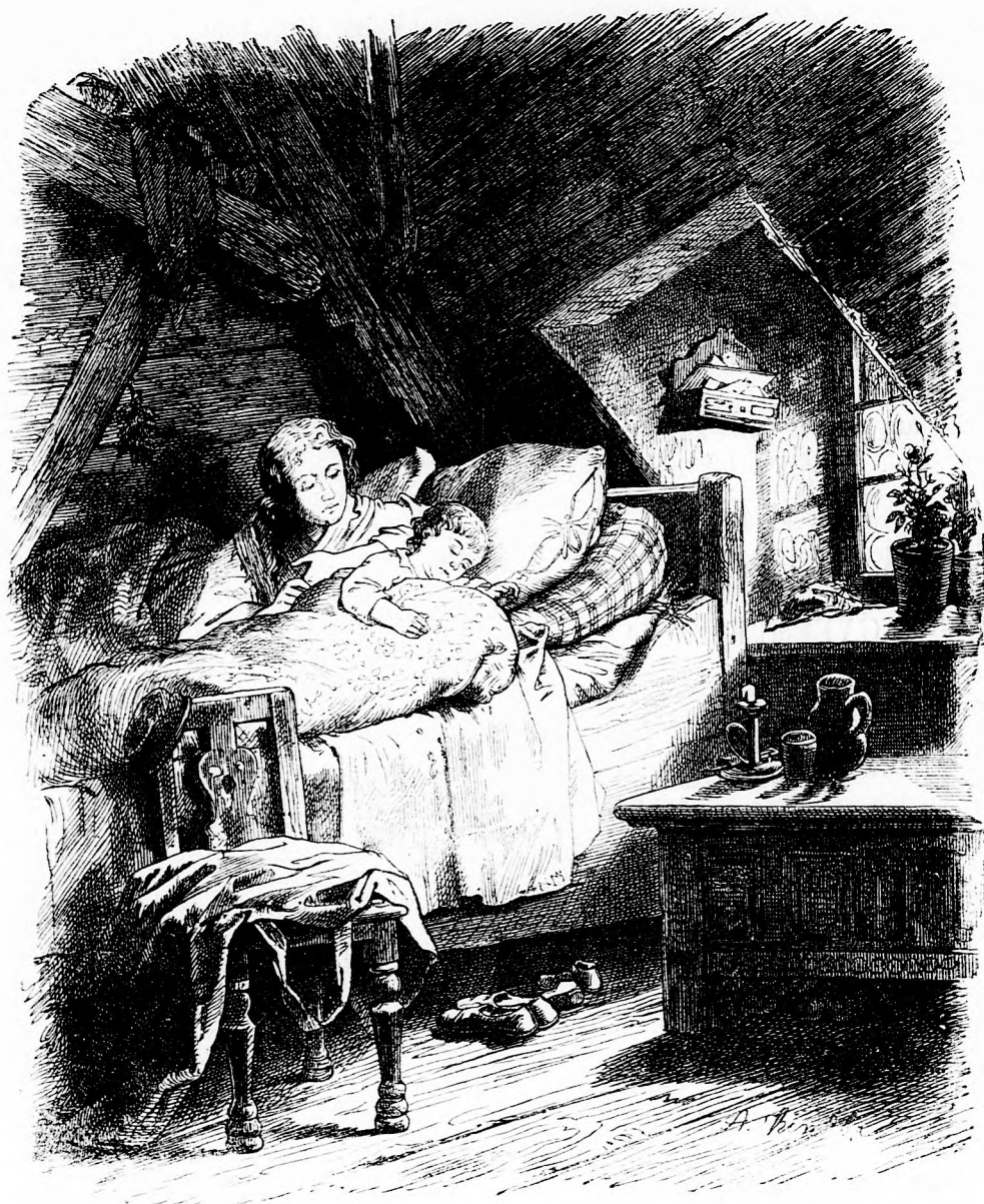
A GYERMEK ÁLMA (Lásd a 75. l.)

tok, aztán vegyetek egy csomó fehér és ugyanannyi fekete gombot vagy babot vagy kövecskét. A játékot ketten játszák, egyik a fehér, másik a fekete színnel. A játék