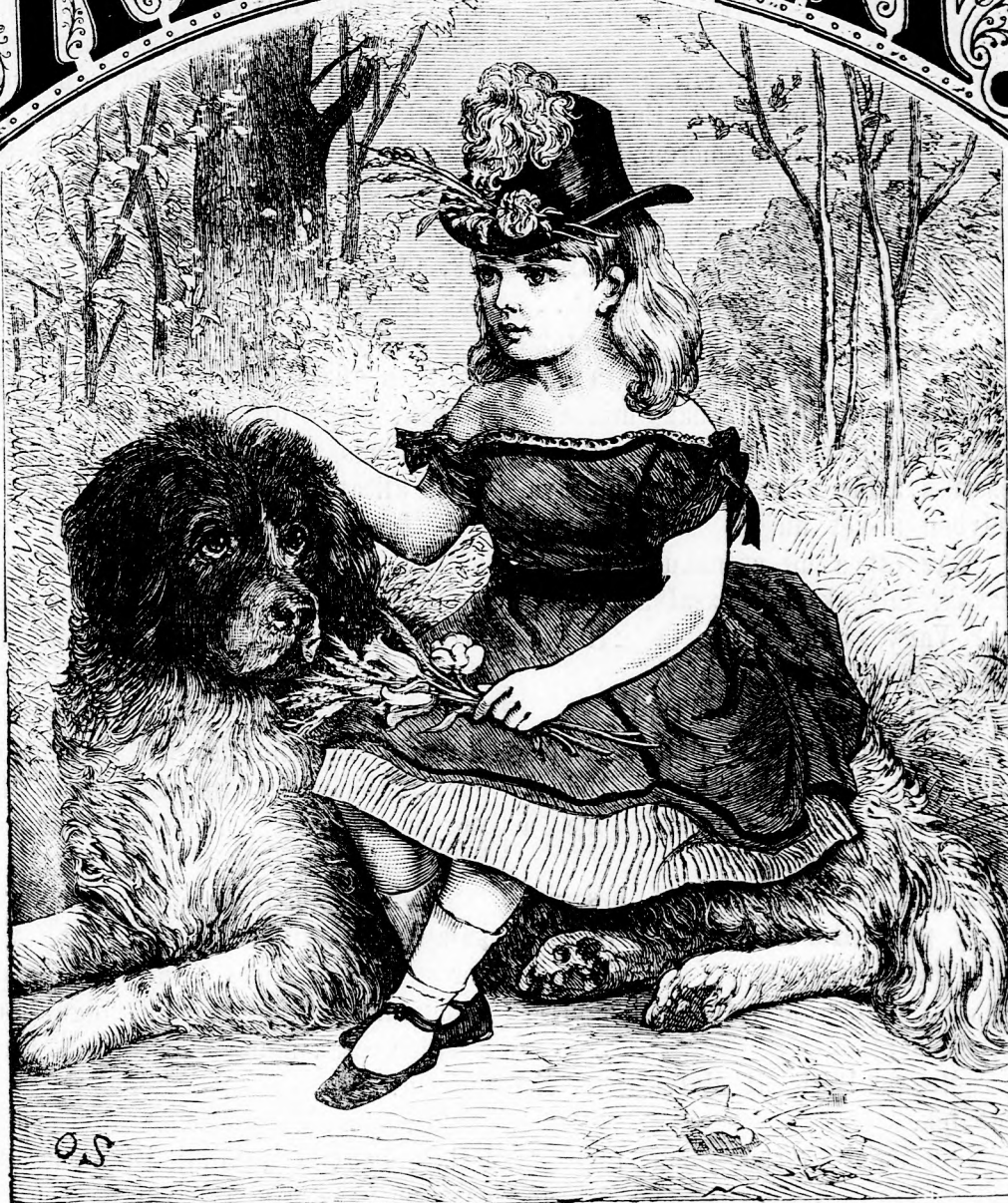
Az ÉLŐ PAMLAG. (Lásd a 78. l.)