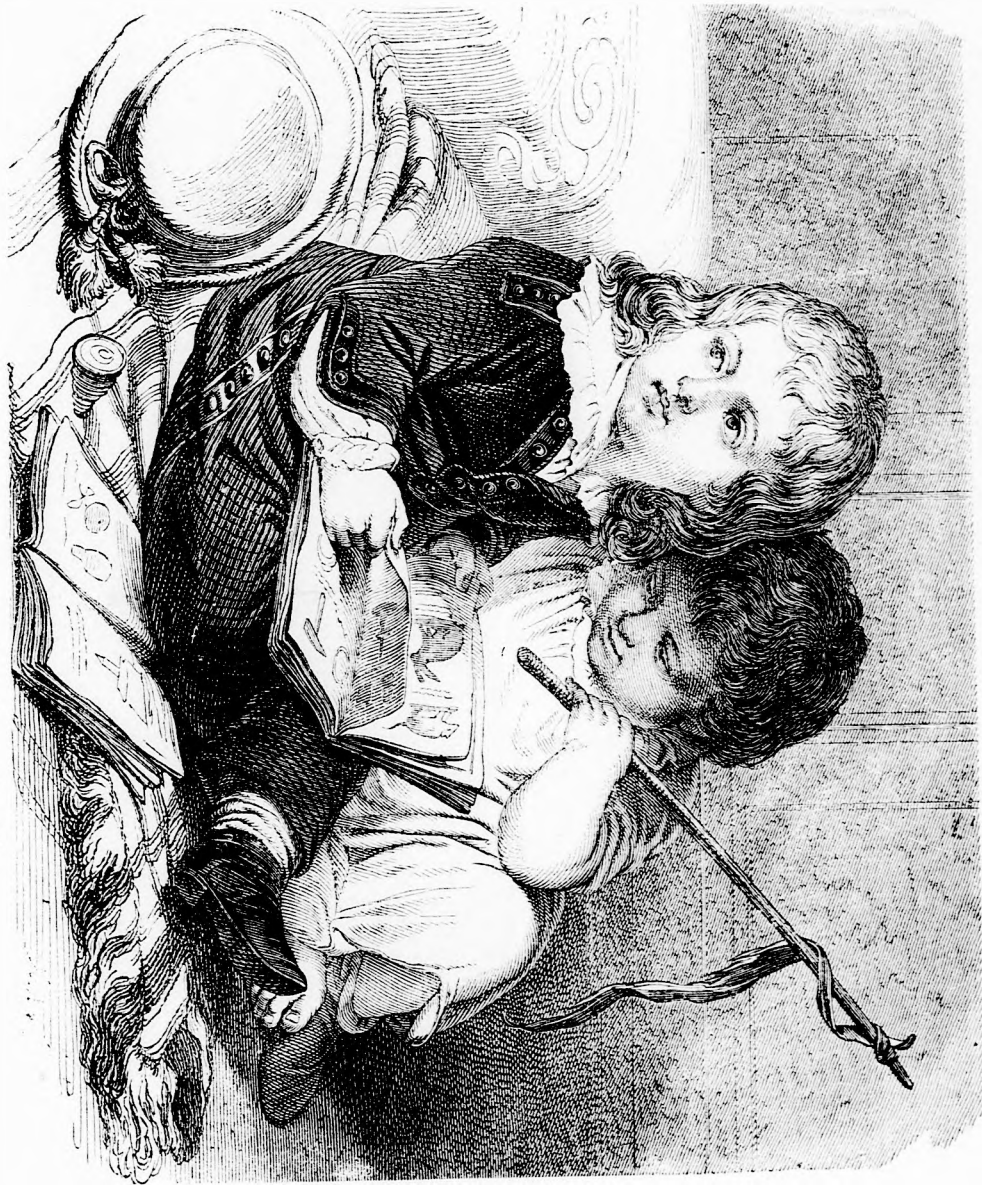
Az Új Képek-könyv. (Lásd a 158. l.)

elbocsátották a vitorlát, melyen Peti ült s az Petivel együtt bezuhant a hordóba, mely tele volt vízzel. Ké- zelhetni, hogy ordított és kapálozott Peti, míg végre kiszabadult; szinte beteg lett a tréfába s a jószívü Ma-