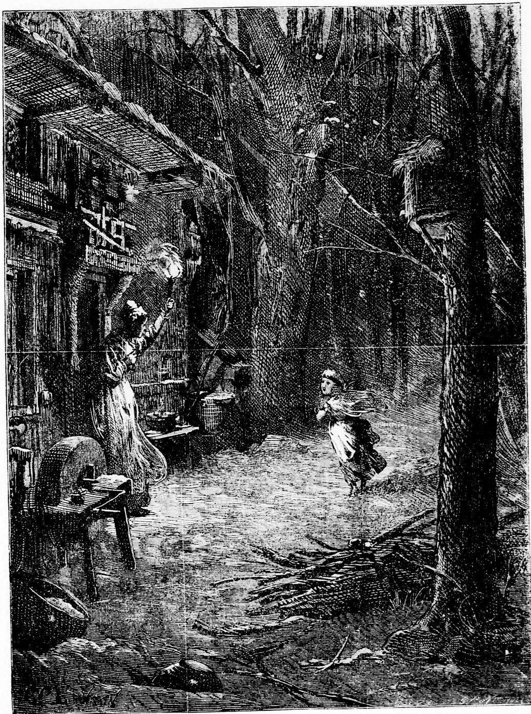
KIÁLTÓ SZÓ A SÖTÉTBEN. (Lásd a 159. l.)