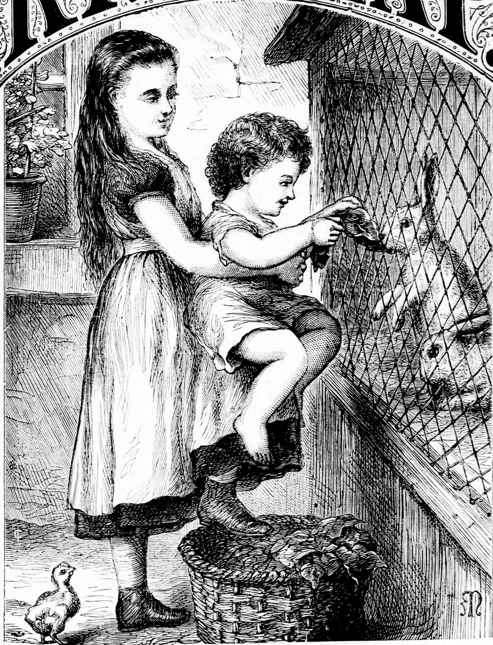
NYULETETÉS. (Lásd a 318. l.)