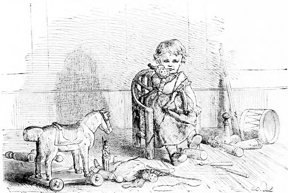
A KIS HADVEZÉR. (Lásd a 319. l.)

Matyi pedig szülei mellett maradt és gazdálkodtak szorgalmasan. Nem sokára új telepítvényesek is jöttek oda s néhány évvel később már csinos falu állt ott s a faluban Gergely ur családja volt a legtekintélyesebb. Még később aztán Gergely ur átadta a gazdaságot Matyinak s boldogan élnek ott még most is, ha meg nem haltak.