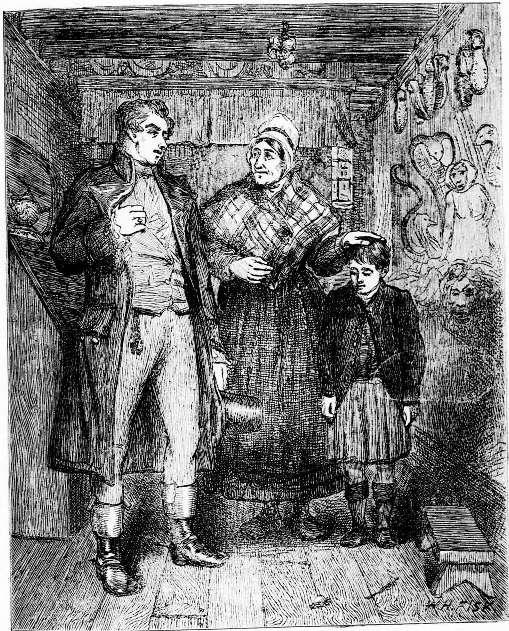
NÉNÉM ASSZONY EZ ITT AZ ÖN FIA? (Lásd a 314. l.)