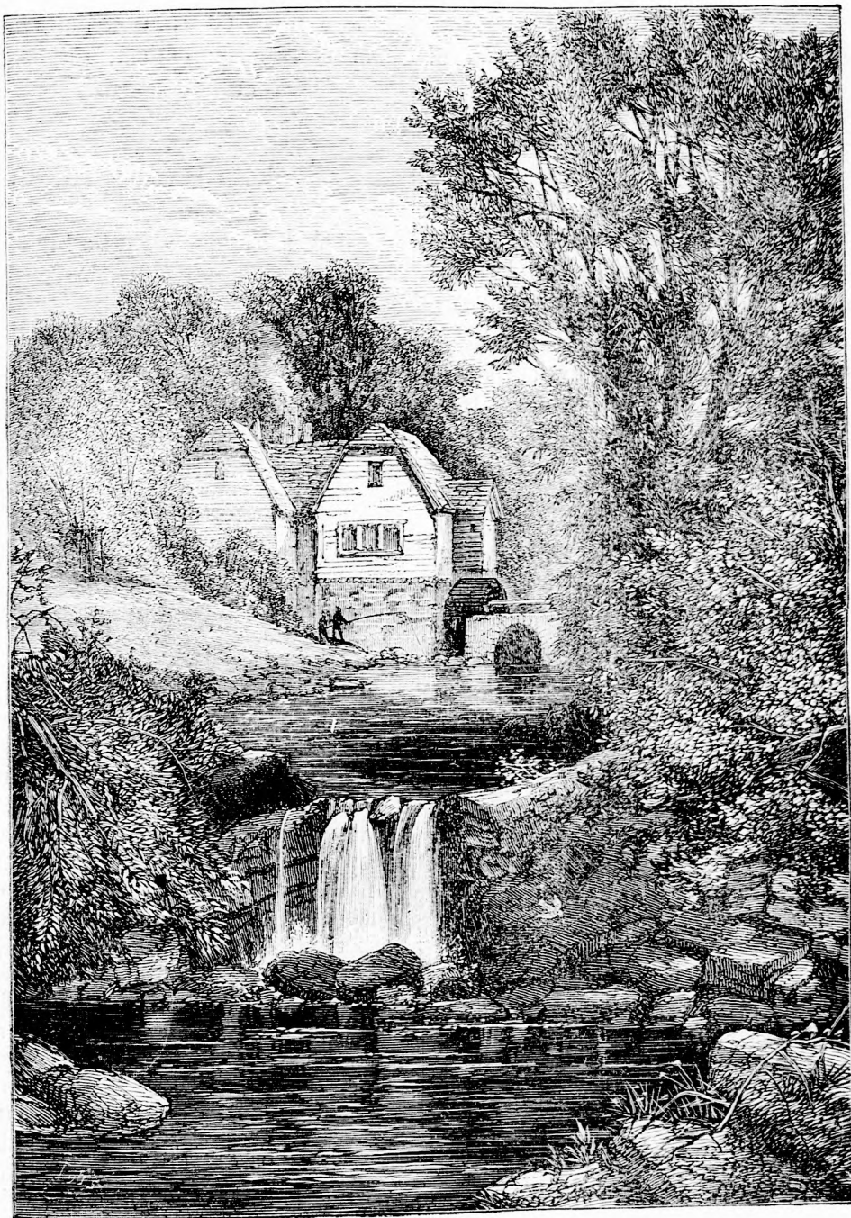
„A MALOM, MELYBEN ATYÁM MOLNÁRMESTER VOLT.“ (L. a 319. l.)