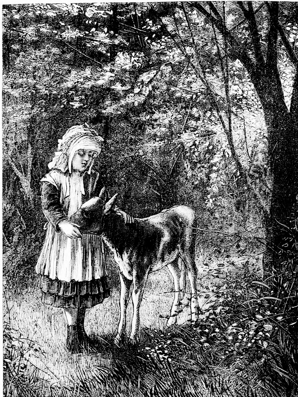
AZ ELTÉVEDT BORJUSKA. (Lásd a 319. l.)