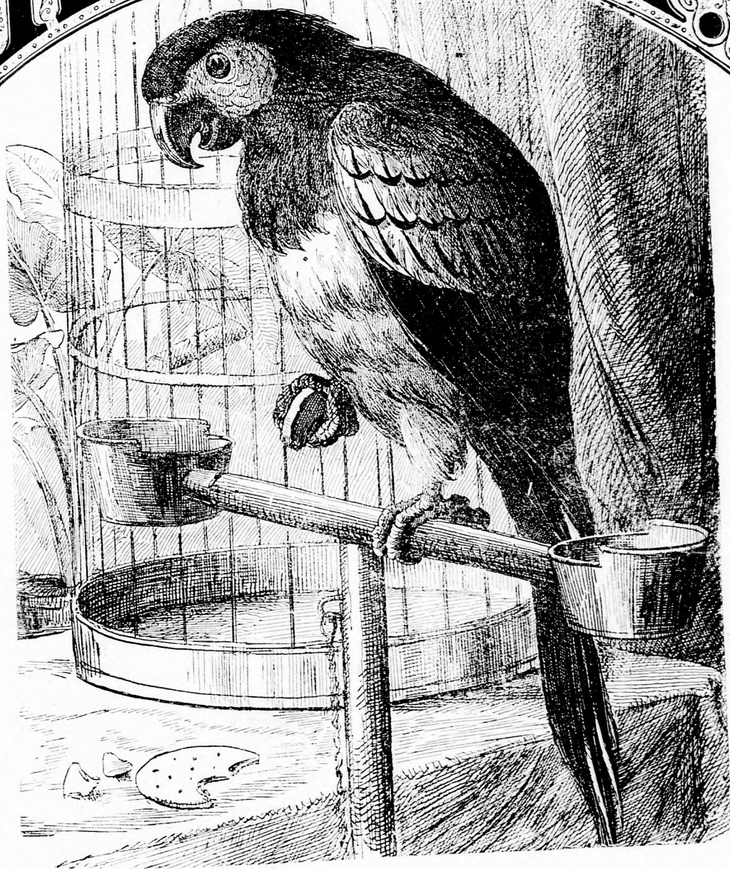
AZ ŐREG JÓKÓ. (Lásd a 165. l.)