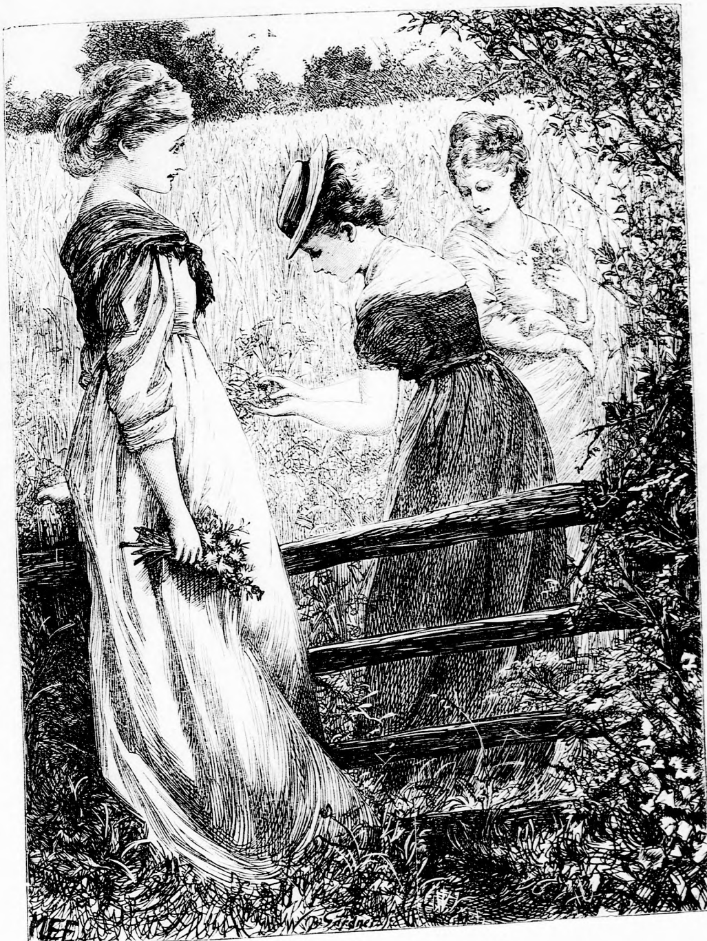
BUZAVIRÁG, (Lásd a 175. l.)