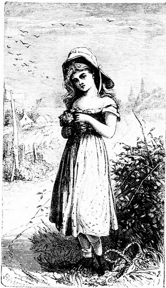
MEZŐN. (Lásd a 175.1.)

bátyjától, sőt még szemébe sem mert tekinteni; félt, hogy Jenő talán kérdezősködni fogna. Viszont épen ezért ohajtott Ferkó mentül előbb oly per-