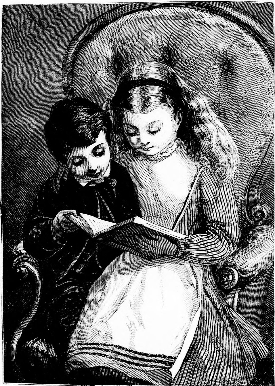
EGYÜTT. (Lásd a 167. l.)

Pest-bécsi irodalmi és művészeti intézet Deutsch testvérek. — Felelős szerkesztő: Forgó bácsi. Ára negyedévre 1 ft. 20 kr. — Megjelen hetenként egyszer 16 oldalon. —