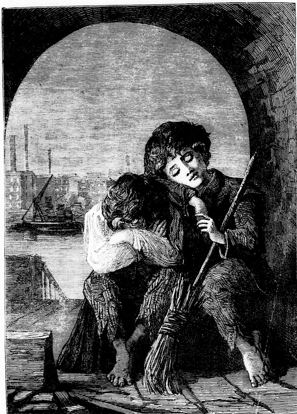
SZEGÉNY FIUK ÁLMA. (Lásd a 107. l.)