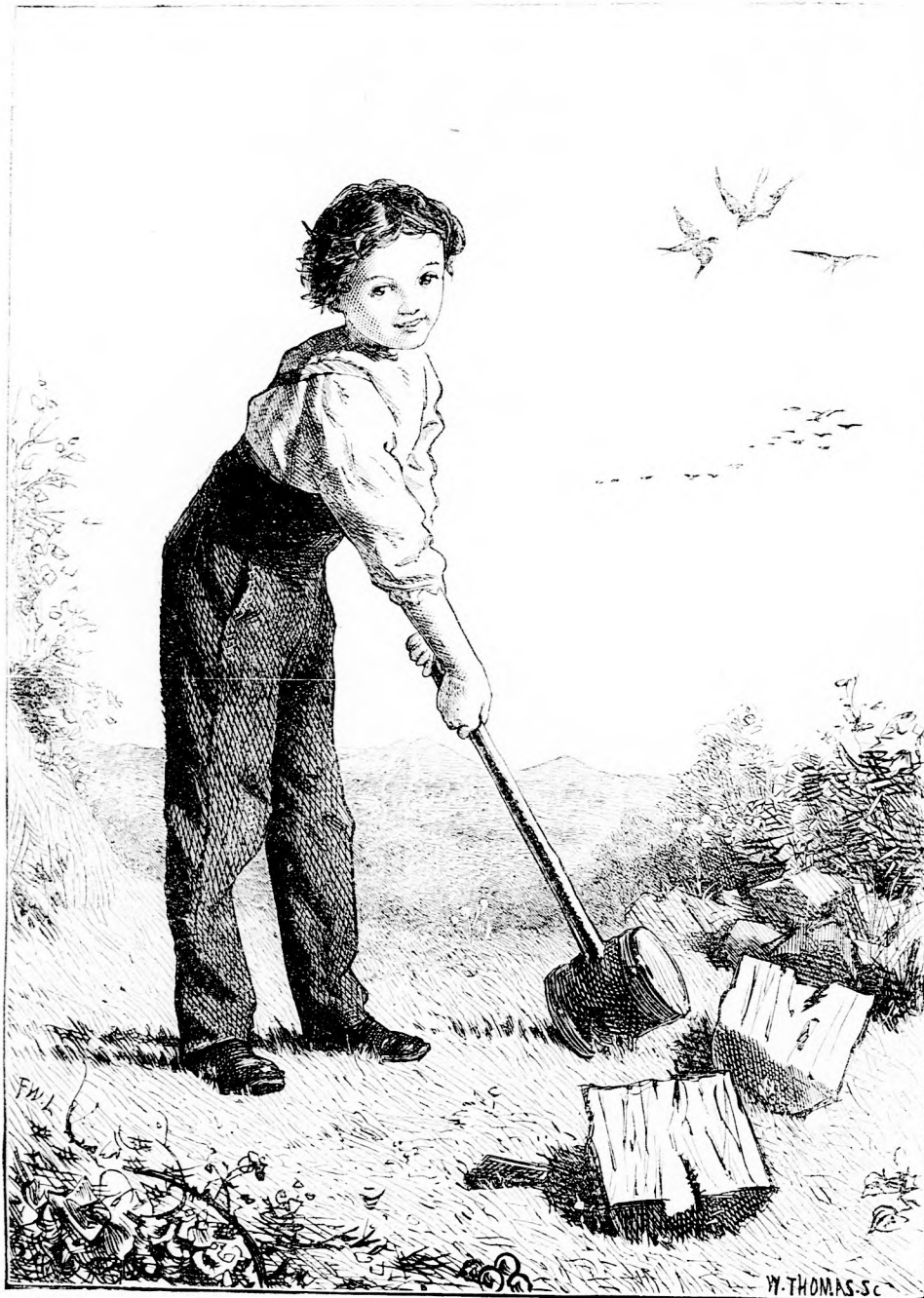
NAGYRATERMEIT KIS EMBER. (Lásd a 167. l.)