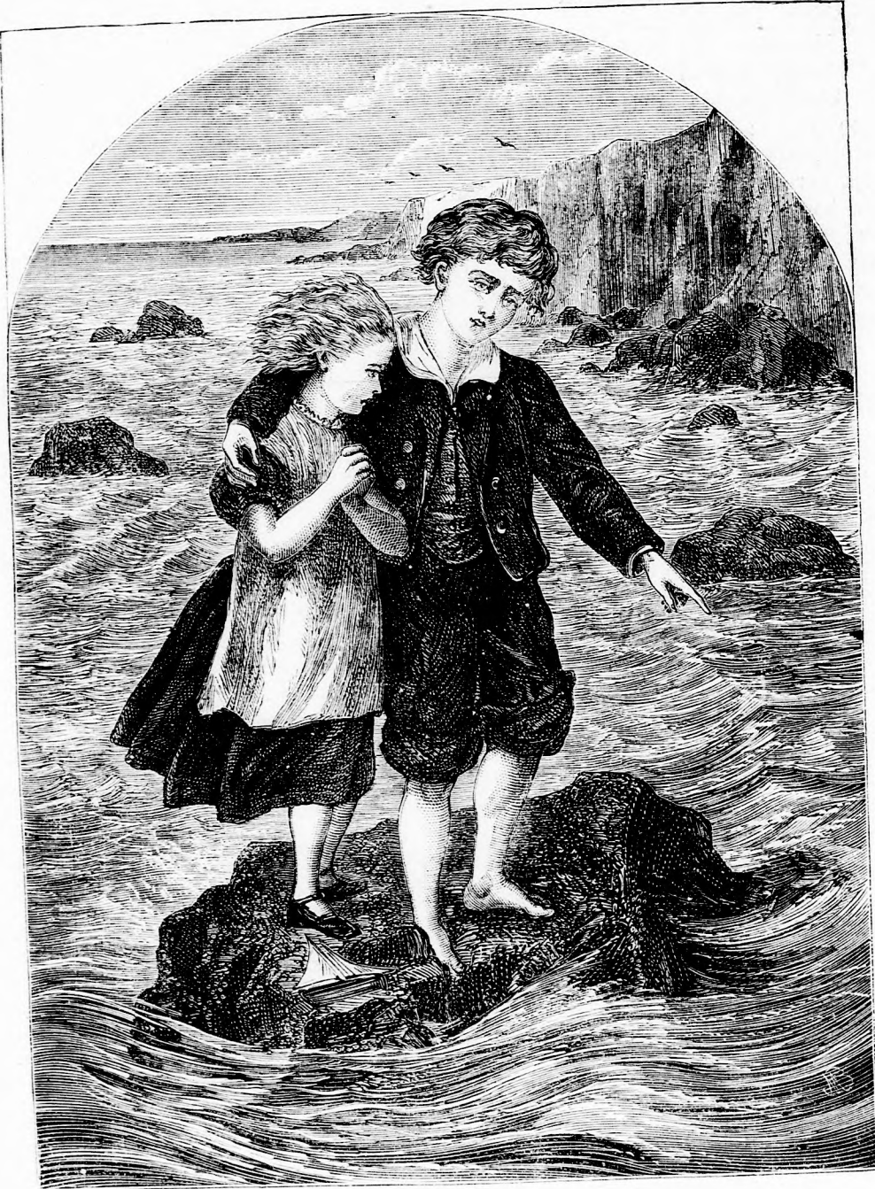
GYERMEK A SZIRTEN. (Lásd a 214. l.)

Pest-bécsi irodalmi és művészeti intézet Deutsch testvérek. Felelős szerkesztő: Forgó bácsi. Ára negyedévre 1 ft 20 kr. — Megjelen hetenként egyszer 16 oldalon. —