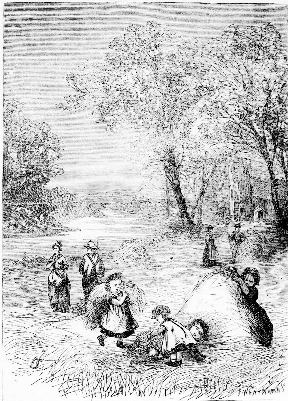
RÉTEN. (Lásd a 219. l.)