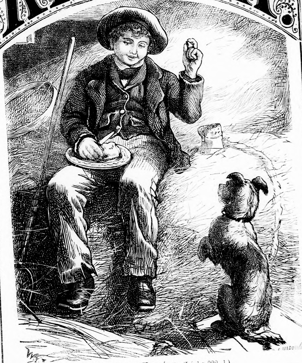
A MI CSUTKA KUTYÁNK. (Lásd a 222. l.)