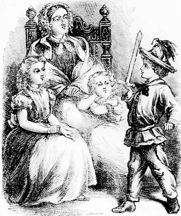
Marci vitéz bátor bajnok, Mersze fogalmat halad