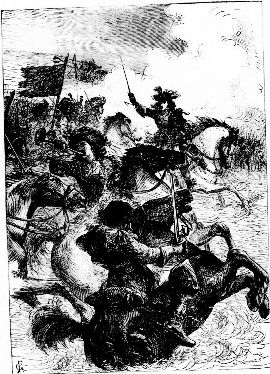
EUGEN HERCZEG. (Lásd a 271. l.)

Pest-bécsi irodalmi és művészeti intézet Deutsch testvérek. Felelős szerkesztő: Forgó bácsi . Ára negyedévre 1 frt. 20 kr. — Megjelen hetenként egyszer 16 oldalon.