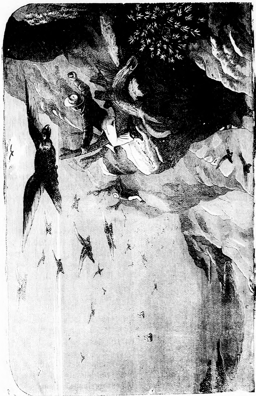
HARCZ A SASOKKAL. (Lásd a 270. l.)