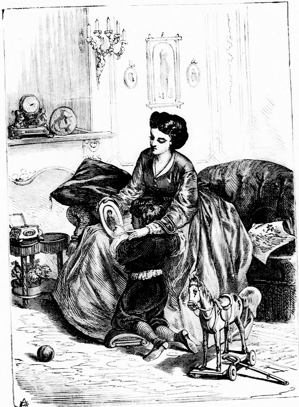
AZ ÁTYA ARCZKÉPE (Lásd a 270. 1.)