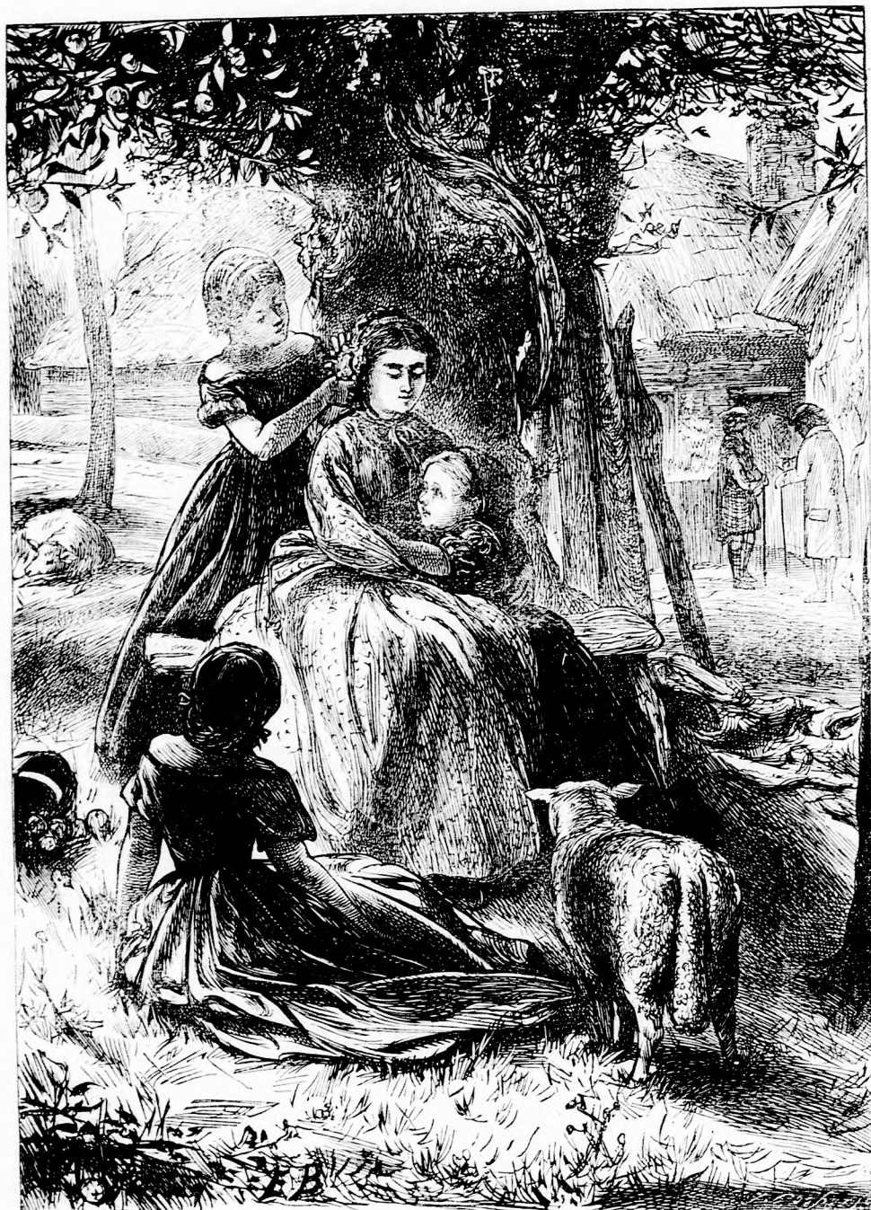
Kis FODRÁSZNÉK. (Lásd a 262. l.)