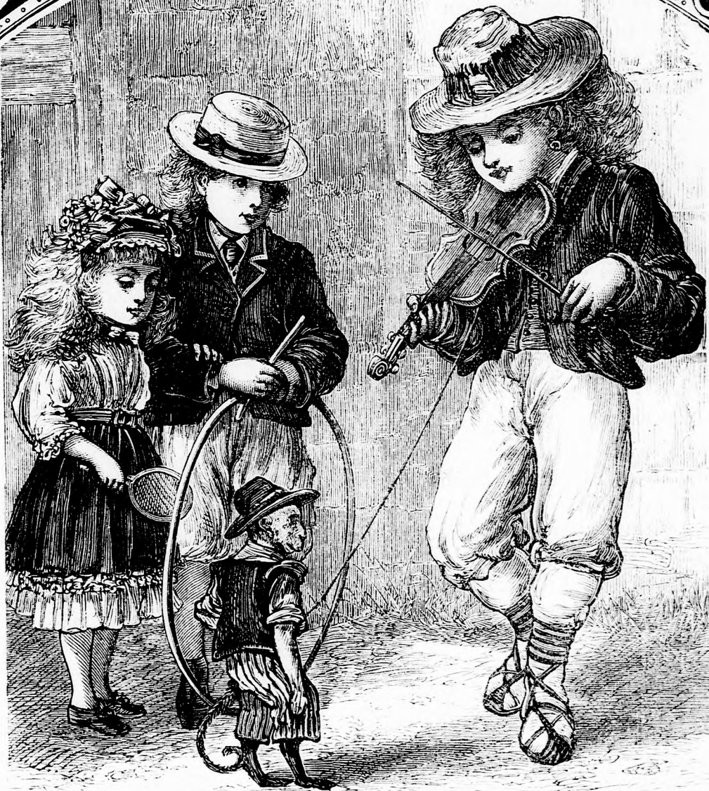
FURCSA LEGÉNYKE. (Lásd a 382. l.)