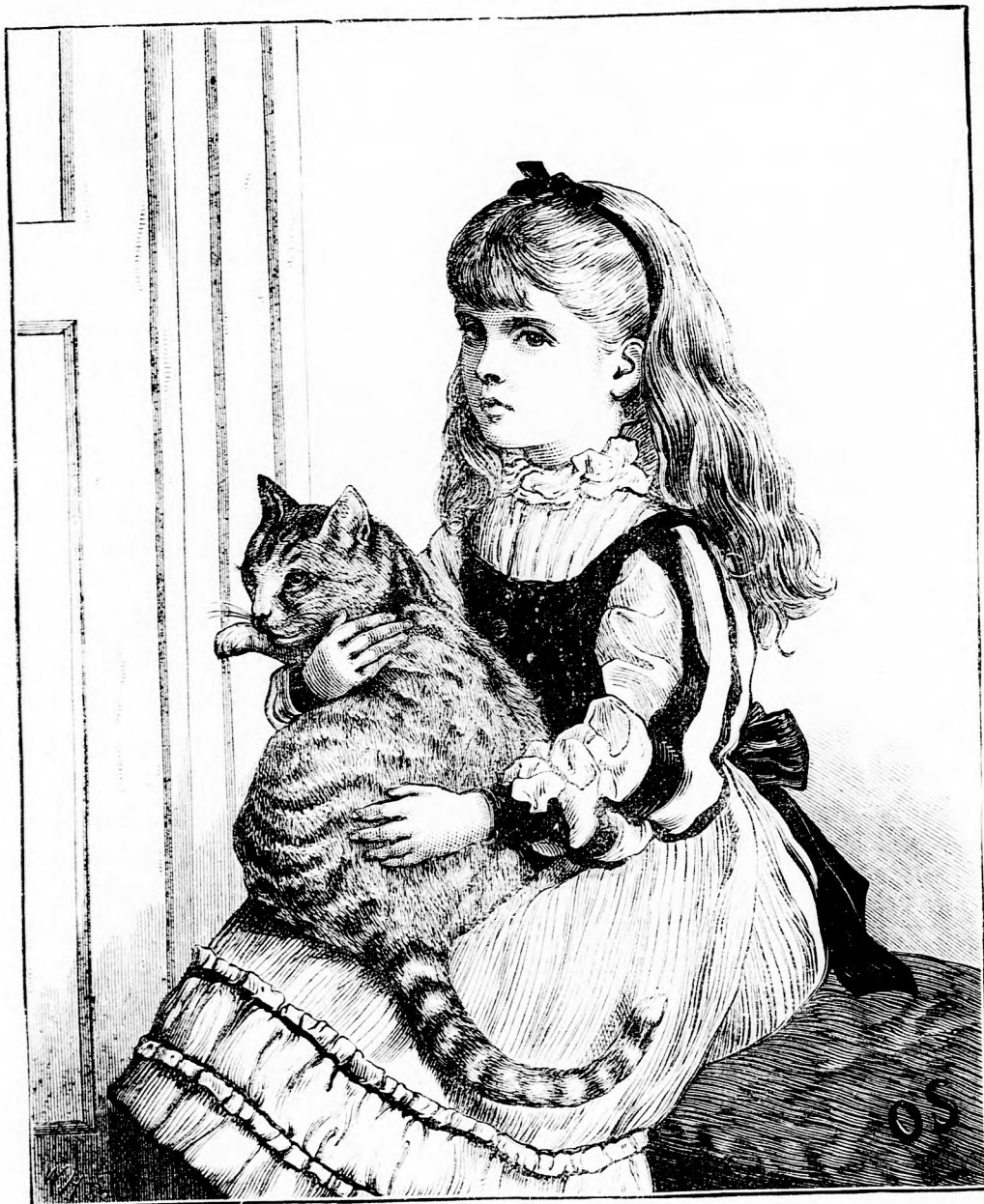
AZ ÉN KANDUROM. (Lásd a 374. l.)