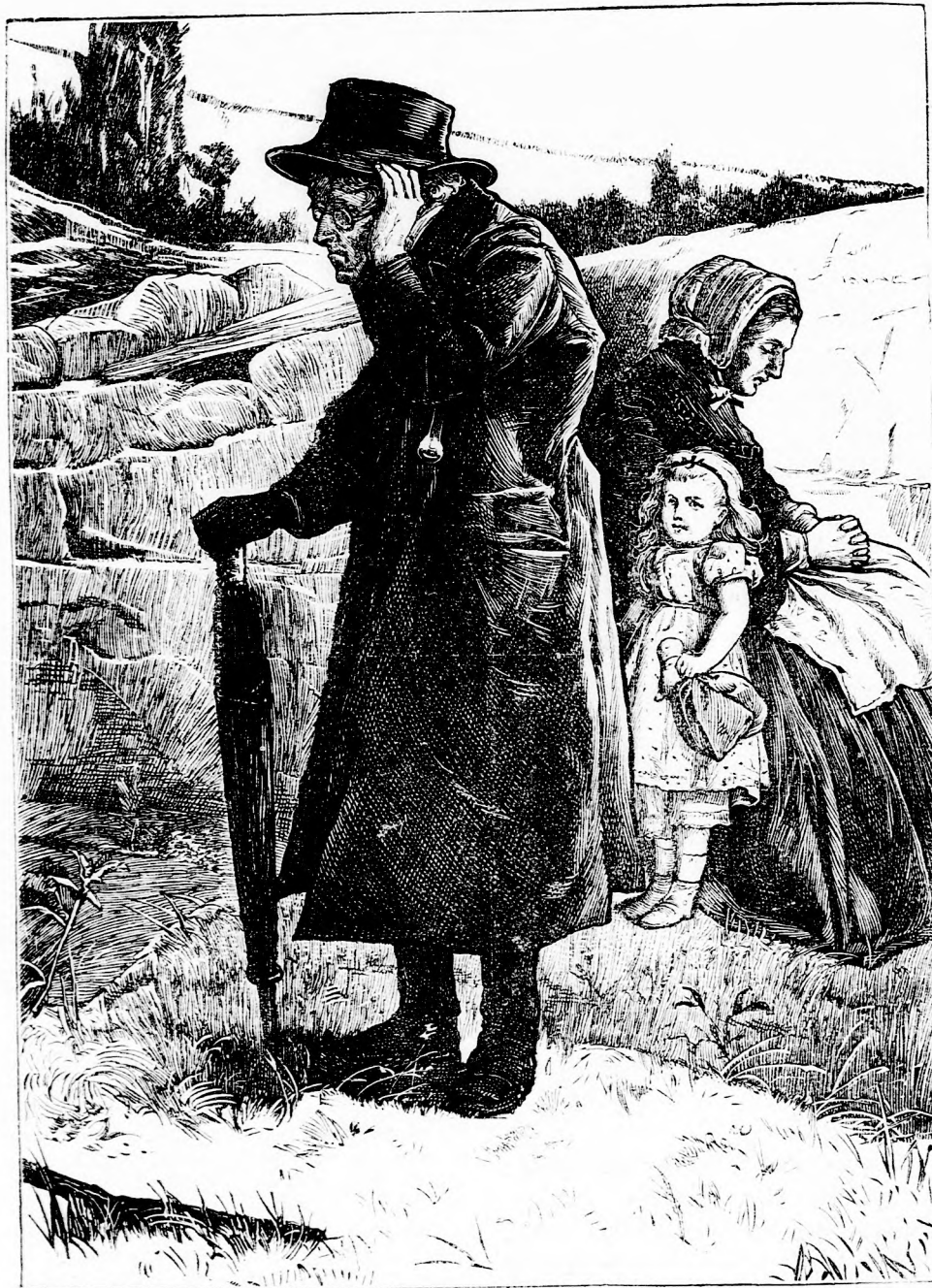
SZÁZ ÉVVEL. (Lásd a 374. l.)

Deutsch testvérek irodalmi és művészeti intézete Pesten. Felelős szerkesztő: Forgó bácsi. Ara negyedévre 1 frt 20 kr. — Megjelen hetenként egyszer 16 oldalon. —