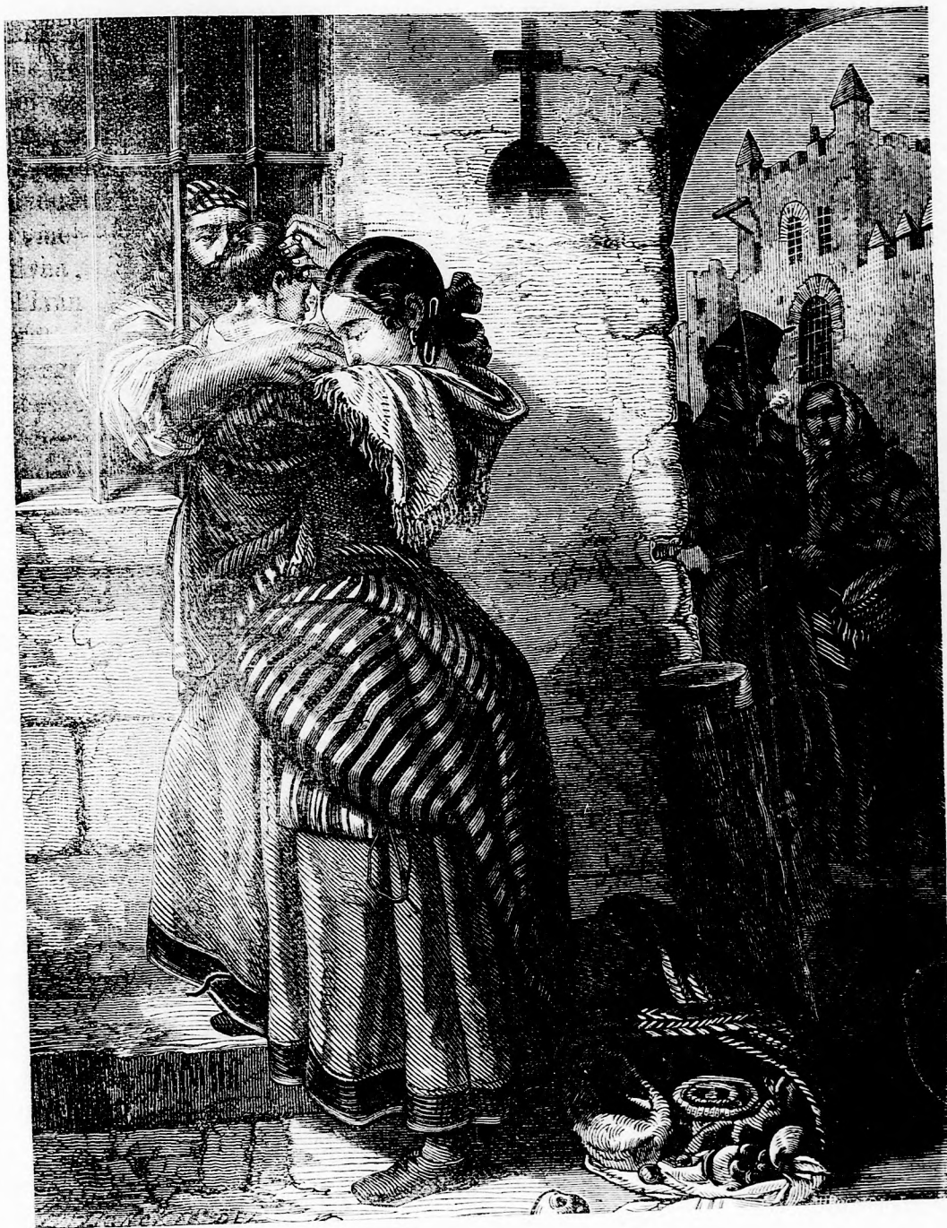
A RABLÓ GYERMEKE. (Lásd a 398. l.)