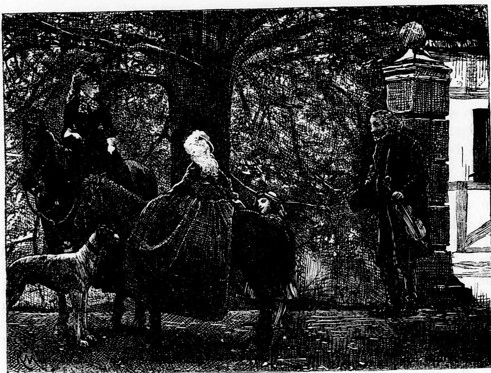
A VÁNDOR MUZSIKUS. (Lásd a 398.1.)