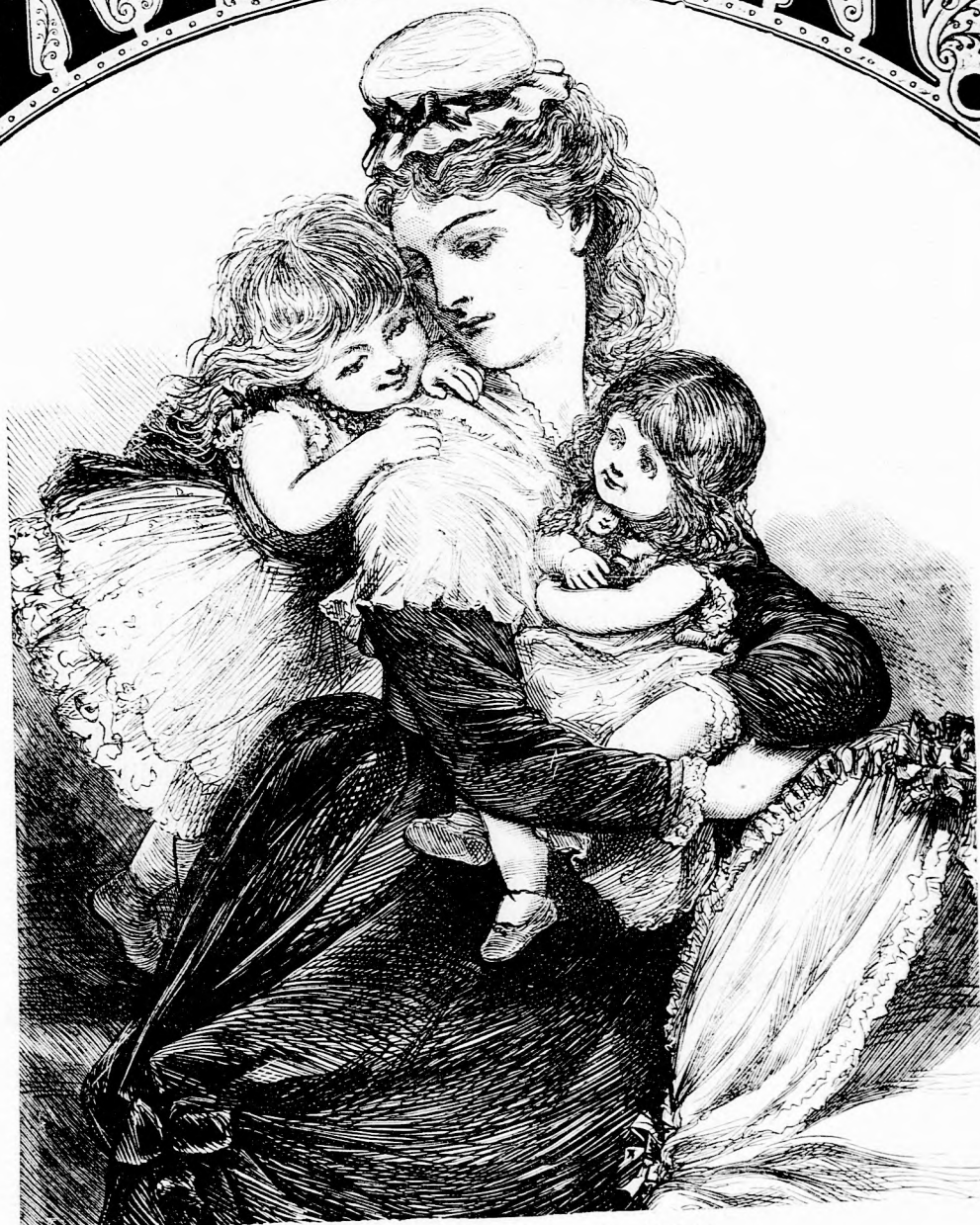
MAMA KEDVENCZE. (Lásd a 394. l.)