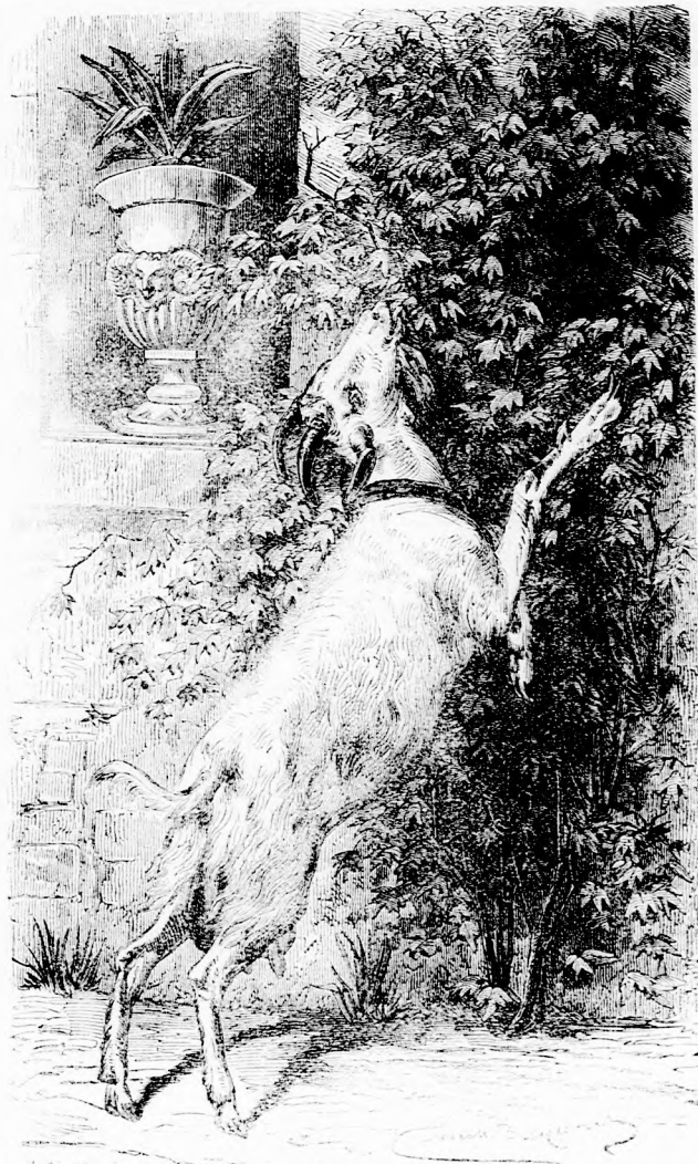
LAKMÁROZÓ KECSKE. (Lásd a 399. l.)

ŐSZRE járt az idő s a bérczes Kárpátok közt, hol az a két történet, melyeket elmondandók vagyunk, megesett, már erősen emlékeztetett minden a tél közeledésére. Hideg szél süvöltött kint s bizony már jól esett a meleg kályha, melynél Iván nővére, Anna, egy szombat este sütkörésztek, mialatt édes anyjok kint a konyhában főzögetett. Édes atyjok már nem élt s a szegény özvegyasszonynak elég gondjába került, hogy gyermekeit fölnevelje. De mint szerető anya szívesen áldozott értök mindent s beléjük helyezte öreg napjainak minden reményét.