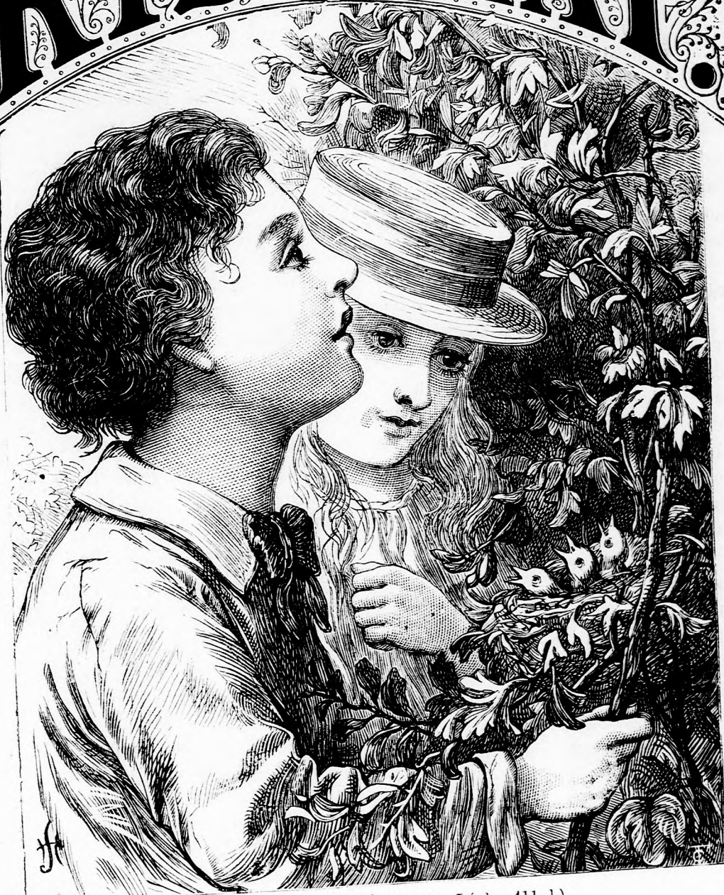
AZ ANYA-MADÁR KÉRELME. (Lásd a 411. l.)