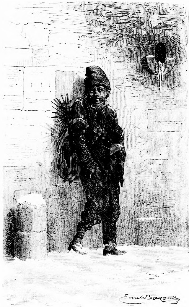
A KIS KÉMÉNYSEPRŐ TÉLEN. (Lásd a 411 l.)

„Oh kedves jó papa! Köszönjük szépen! Ez pompás!“ kiáltozák a gyermekek,