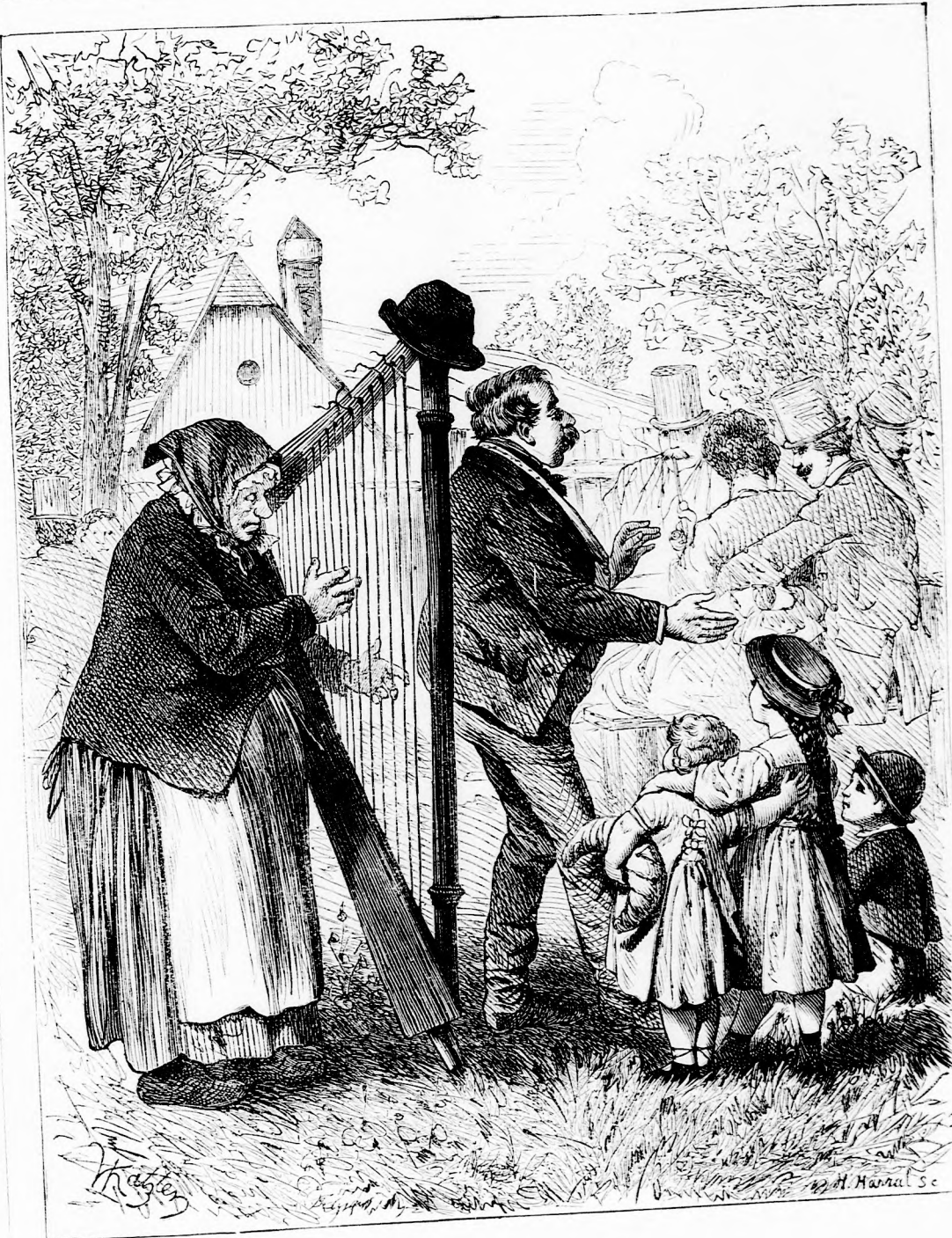
A HÁRFA. (Lásd a 407. l.)