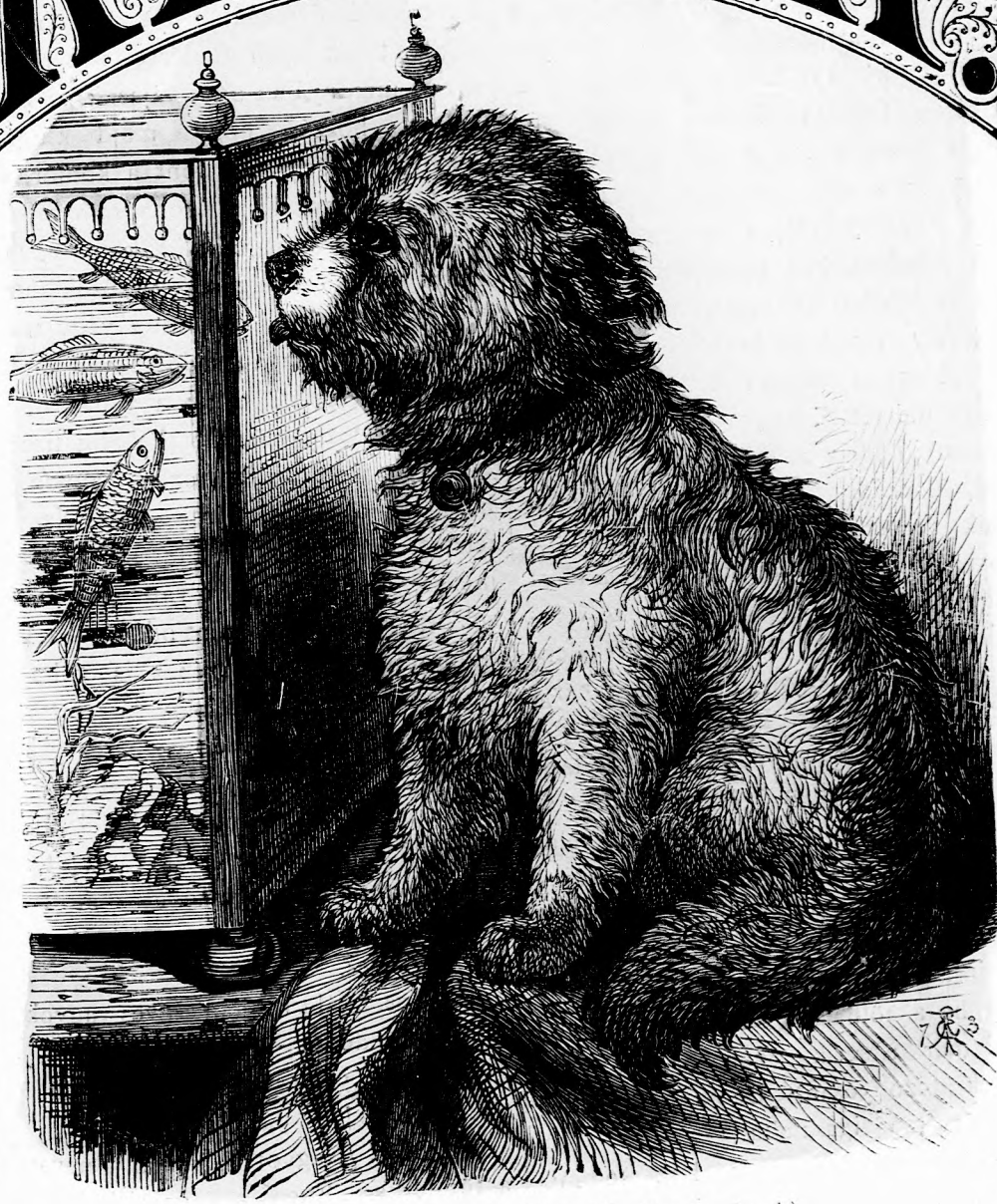
KÁRO ÉS AZ ARANY HALAK (Lásd a 39. l.)