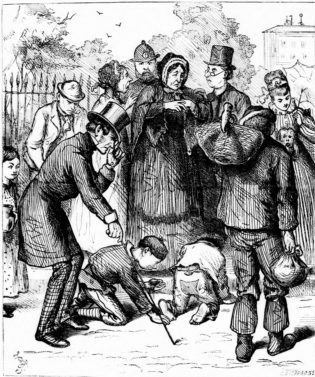
AZ ELVESZETT HUSZAS. (Lásd a 39. l.)