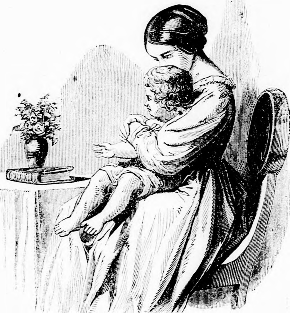
NYUGTALAN FIUCSKA. (Lásd a 38. l.)

„Nem, azt nem fogadhatom el . . . én hántottalak, sértettelek s te ily jószággal viszonzod . . . nem . . . ezt nem érdemlem . . . ezt nem fogadhatom el.“