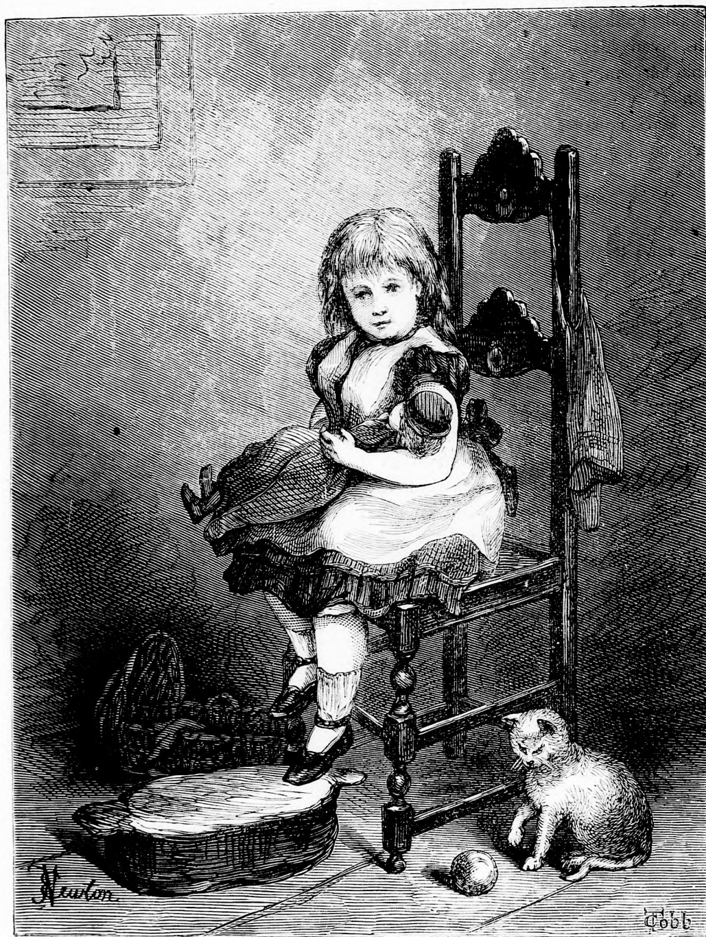
A BABA ALSZIK. (Lásd a 38. l.)

Nyomatott ifj. Deutsch Mór (ezelőtt Deutsch testvérek) könyv- és könyvnyomdai műintézetében Pesten.