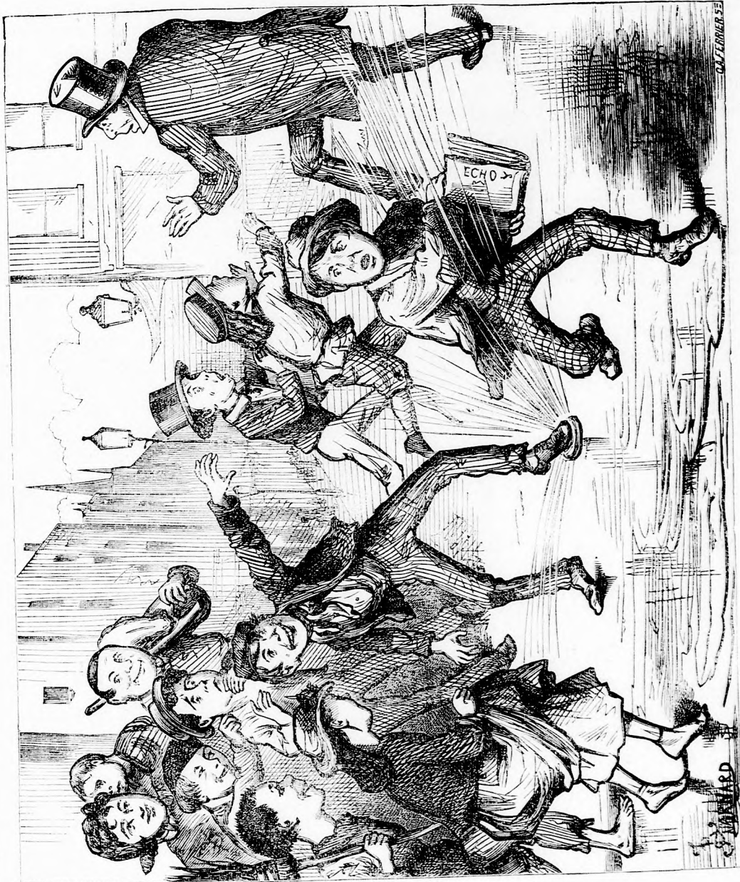
„AZ UTCÁKON CSAVAROGTAK A SÁRBAN.“ (Lásd a 39. l.)

Ezzel letette a fogadalmat, mely örökre a földalatti országhoz lánczolta. Át-