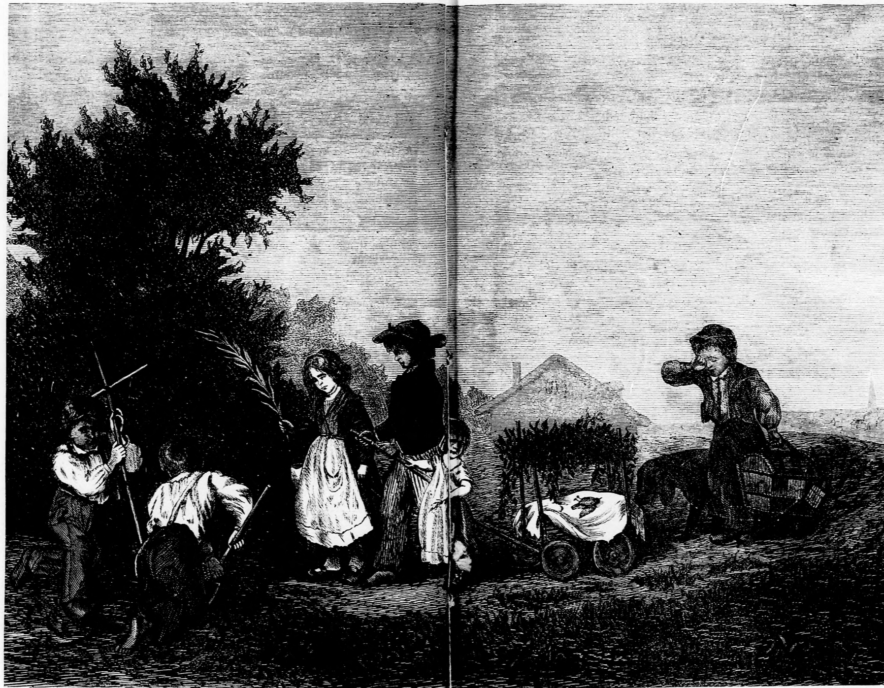
KIS MADÁR TEMÉSE. (Lásd a 42. l.)

„Ohistenem, istenem! Már most mit tegyek! Egész nap súlyos munkát végeztem, csak hogy valamit keressek s beteg leányomnak legalább estére egy kis levest adhaszak, — és vége! Éheznünk, fázunk kell megint! Hiába keresem, a nagy sárban többé