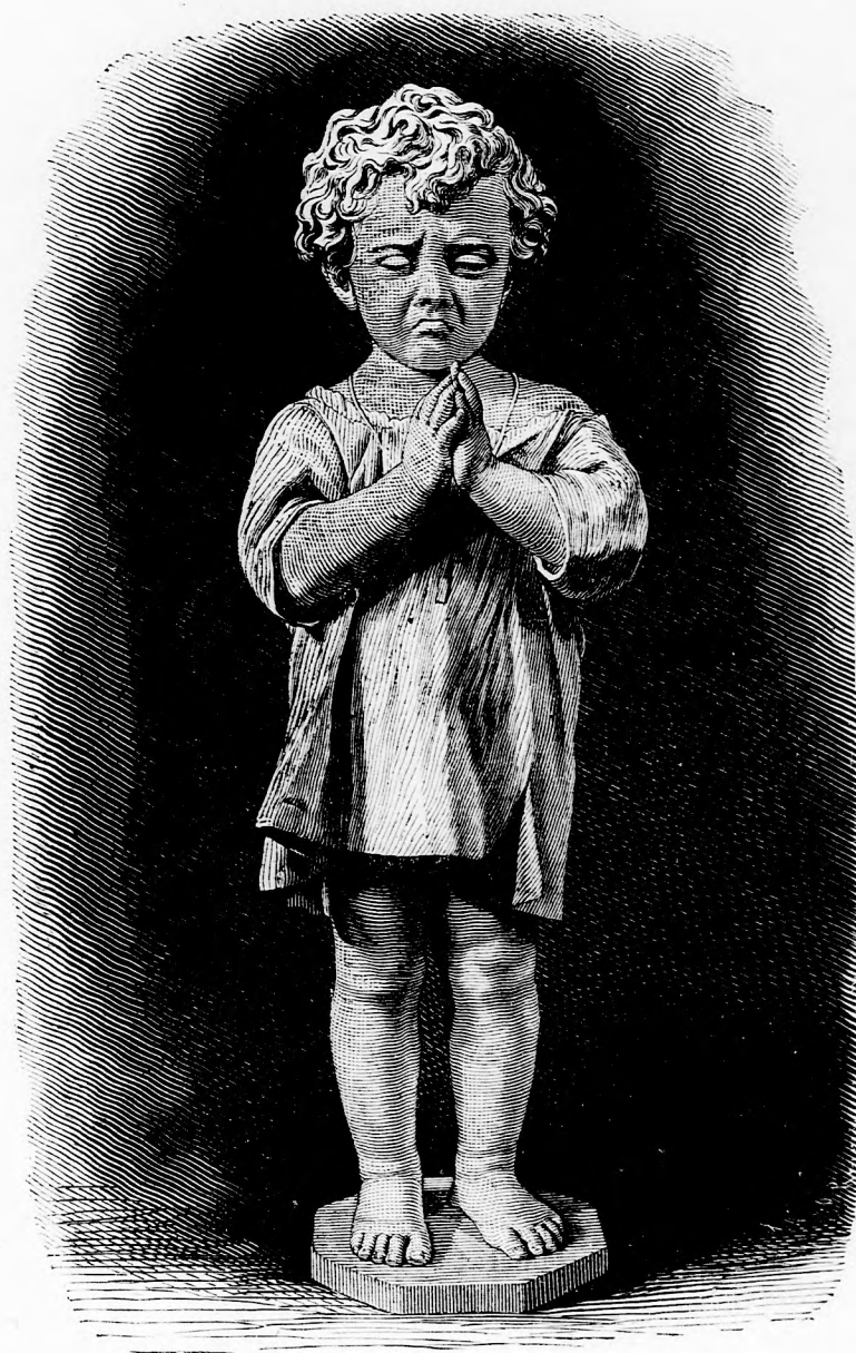
A KI NEM SZERET IMÁDKOZNI. (Lásd a 39. l.)