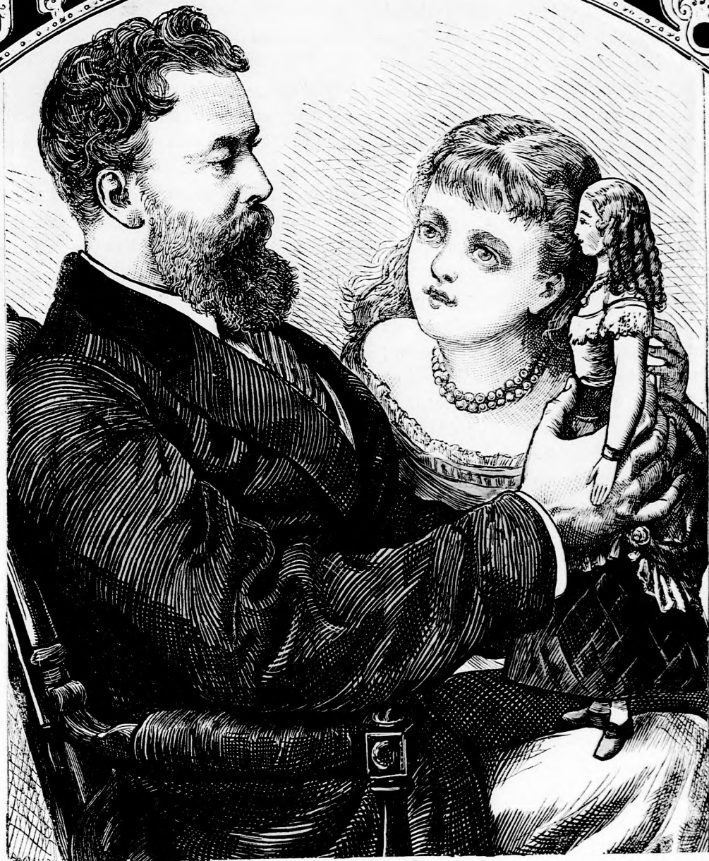
AZ ÚJ BABA. (Lásd a 215 l.)