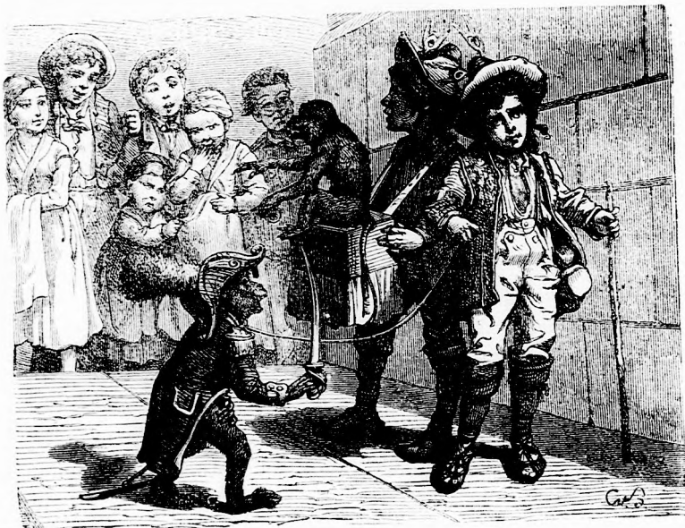
BUMBUM GENERÁLIS. (Lásd a 223. l.)

fiú erre szaladni látta, sietett eléje, nehogy valami baja essék. De Peti hamarabb ért a pallóra s épen mikor közepén volt, hátra nézett, valjon üldözői közel vannak-e; és ugyanezen pillanatban, mert nem nézett lába elé, félre lépett és bebukott a patakba. Örzse asszony épen e pillanatban ért a patak szélére s kétségbeesetten ugrott fia után, meg nem gondolva, mit tesz, mert hiszen maga