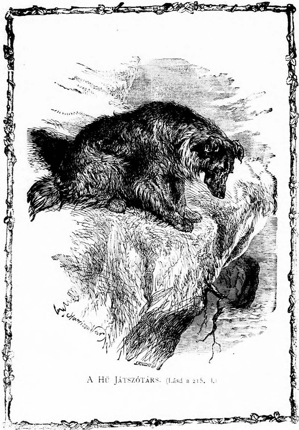
A HŰ JÁTSZÓTÁRS. (Lásd a 215. l.)