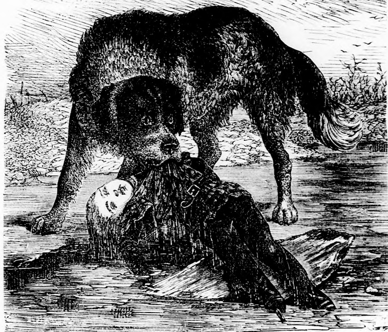
A ROSZ-JÓ KUTYA. (Lásd a 212. l.)