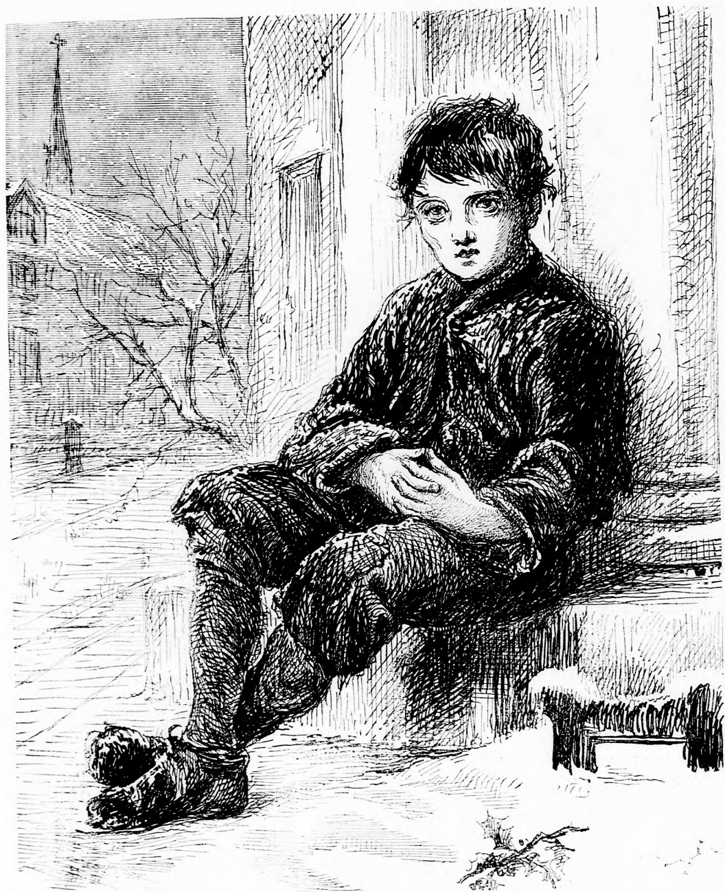
AZ ELHAGYATOTT. (Lásd a 214. l.)

Fel-elős szerkesztő: Forgó bácsi . Kiadó-hivatal: Pest, bálvány-utca 9. sz. Nyomatott Deutsch testvérek könyv- és könyomdai műintézetében Pesten. Ára negyedévre 1 frt. 20 kr. Megjelen hetenként egyszer 16 oldalon.