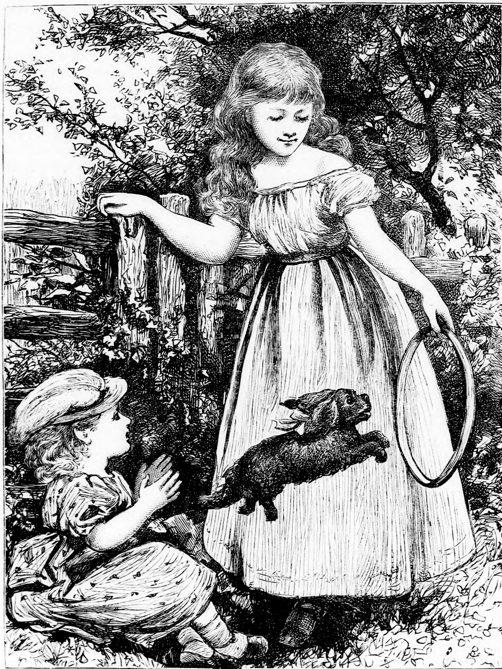
A MI FÜRGENCZÜNK. (Lásd a 239. l.)

Felelős szerkesztő: Forgó bácsi . Kiadó-hivatal: Pest, bálvány-utca 9. sz. Nyomatott Deutsch testvérek könyv- és könyvmdai műintézetében Pesten. Ára negyedévre 1 frt. 20 kr. Megjelen hetenként egyszer 16 oldalon.