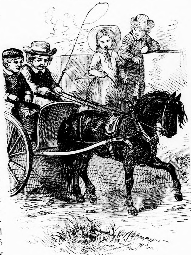
A KIS PONY ÉS GAZDÁJA. (Lásd a 235. l.)

Az a nyájas öreg ur pedig, ki oly boldoggá tette őket, messziről követte Petit s az ablak előtt megállott. Onnan aztán látta, mi történik odabent.