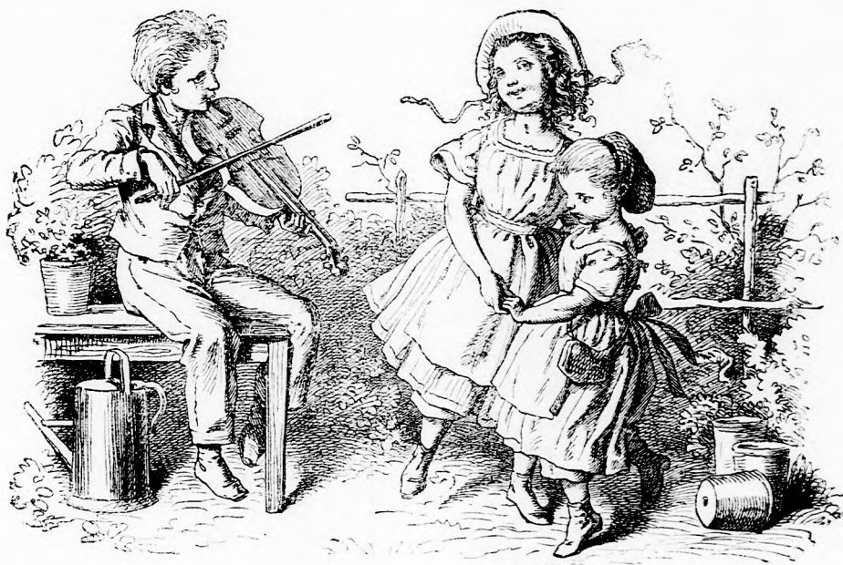
TÁNCZ. (Lásd a 230. l.)

meglepetése, midőn hazatérve, ott találta az ablakban ismét kedvencét, a szép szegfűvirágot, teli bimbóval, még pom- pásabban, mint valaha. Ujjongva rohant hozzá, összecsókolgatta s tánczolt örö- mében, lassanként azonban mégis gon- dolkozni kezdett, hogy hát tulajdonké- pen mily módon került a virág ide visz- sza? És ekkor a mama is megszólalt