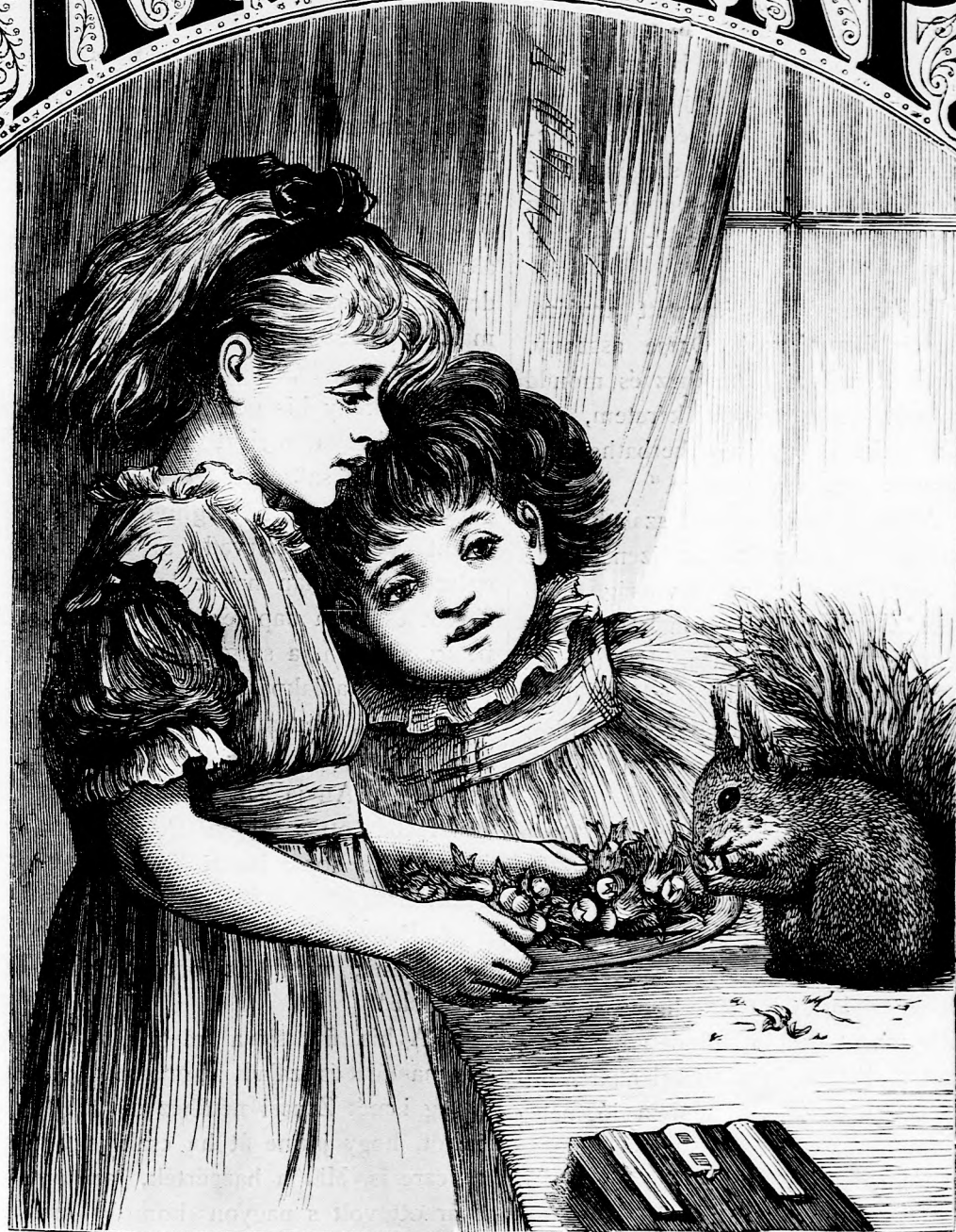
A MI EVETKÉNK. (Lásd a 230. l.)