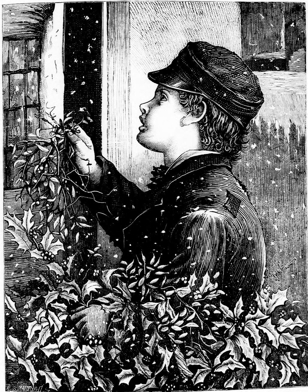
HAZUG TAVASZ. (Lásd a 335. l.)