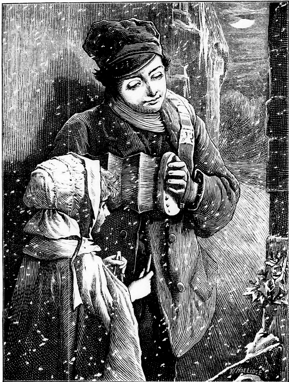
TÉLI HANGVERSENY. (Lásd a 327. l.)