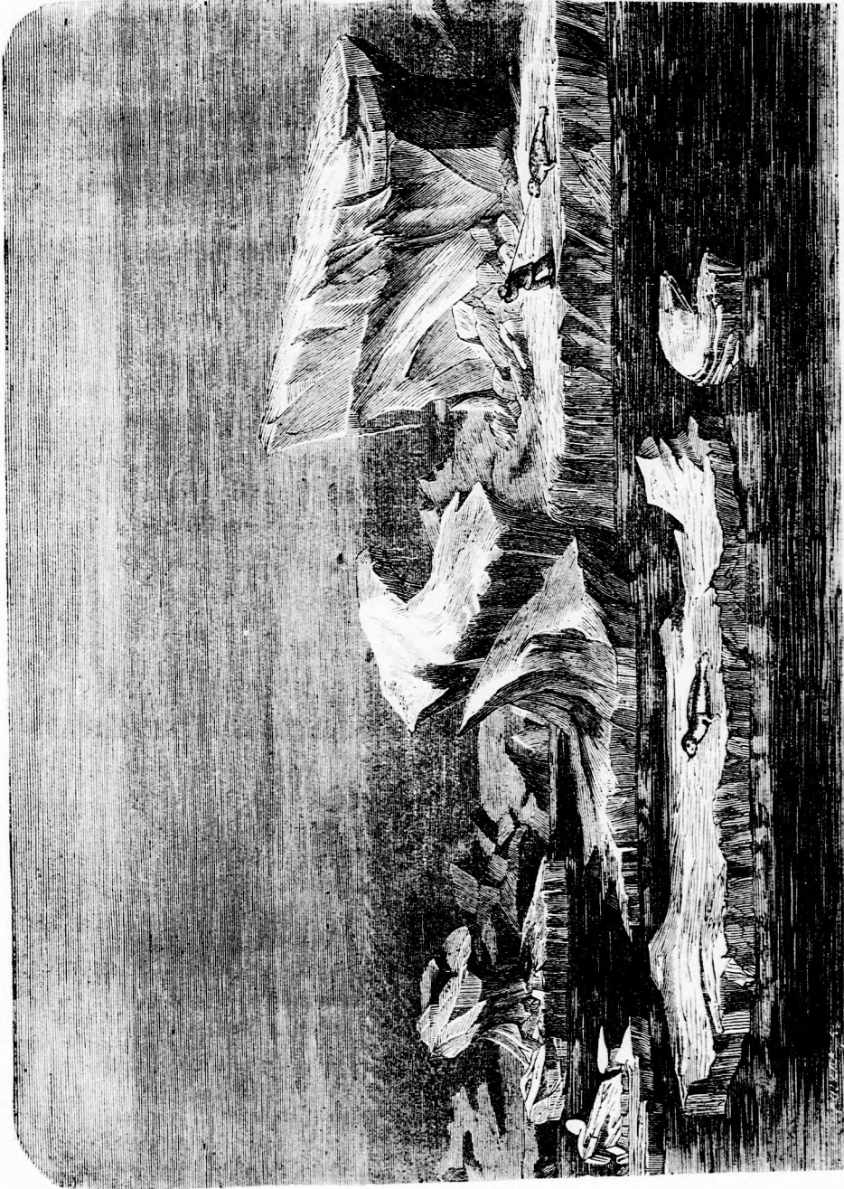
A JÉGHEGYEN. (Lásd a 335. l.)