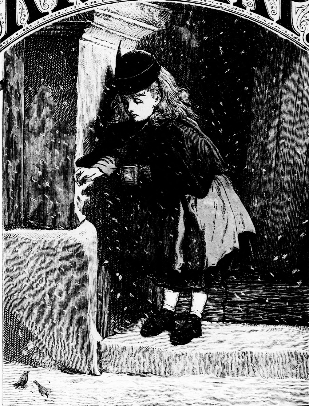
AZ ÉN VEREBEIM. (Lásd a 327. l.)