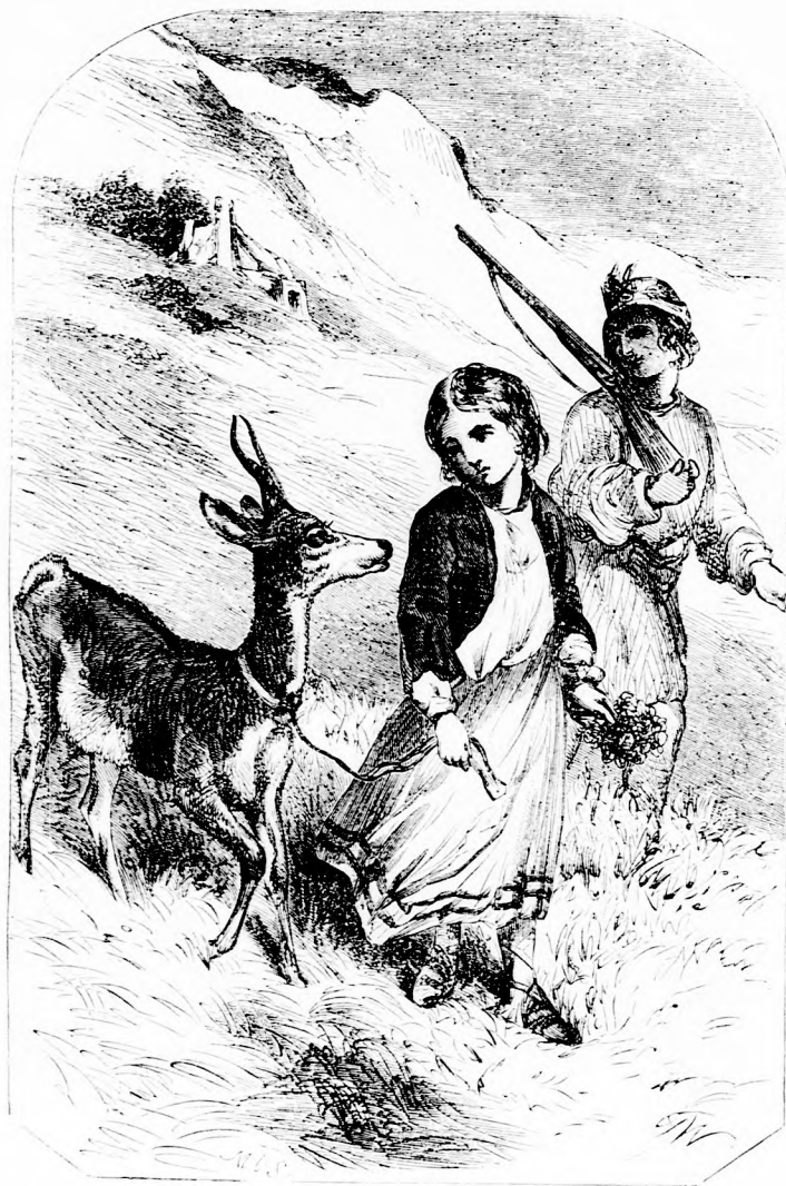
A MI ÖZIKÉNK. (Lásd a 6. l.)