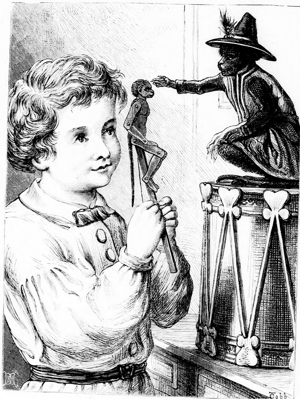
A RÚT HASONMÁS. (Lásd a 6. l.)

Felelős szerkesztő: Forgó bácsi . Kiadó-hivatal: Pest, bálvány utca 9. sz. Nyomatott Deutsch testvérek könyv- és könyvnyomdai műintézetében Pesten. Ára negyedévre 1 frt. 20 kr. Megjelen hetenként egyszer 16 oldalon.