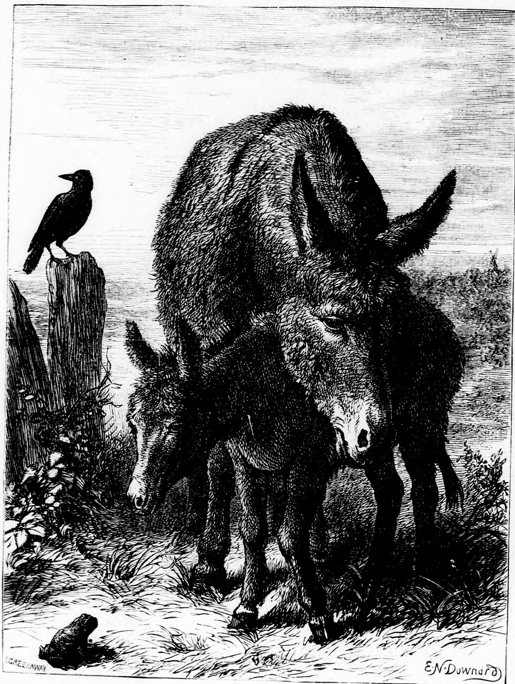
SZAMÁR ÉS CSACSI. (Lásd a 138. l.)

Felölös szerkesztő: Forgó bácsi . Kiadó-hivatal: Budapest, bálvány-utca 9. sz. Nyomatott Deutsch testvérek könyv- és könyomdai műintézetében Budapesten. Ára negyedévre 1 frt 20 kr. Megjelen hetenként egyszer 16 oldalon.