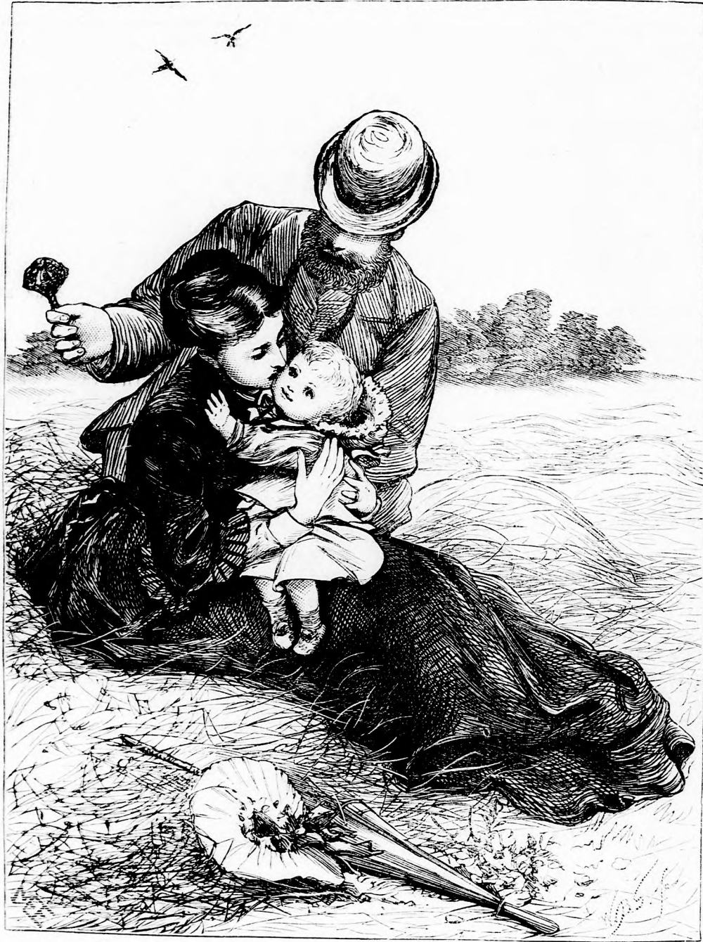
KIS BABA KEREPLOJE. (Lásd a 143. l.)