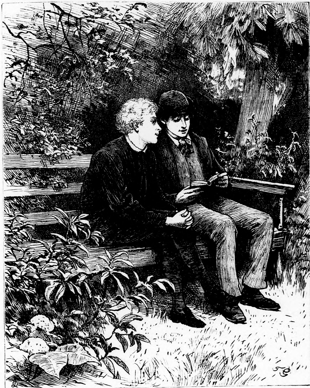
AZ ÉN KÉT ÖCSÉM. (Lásd a 138. l.)