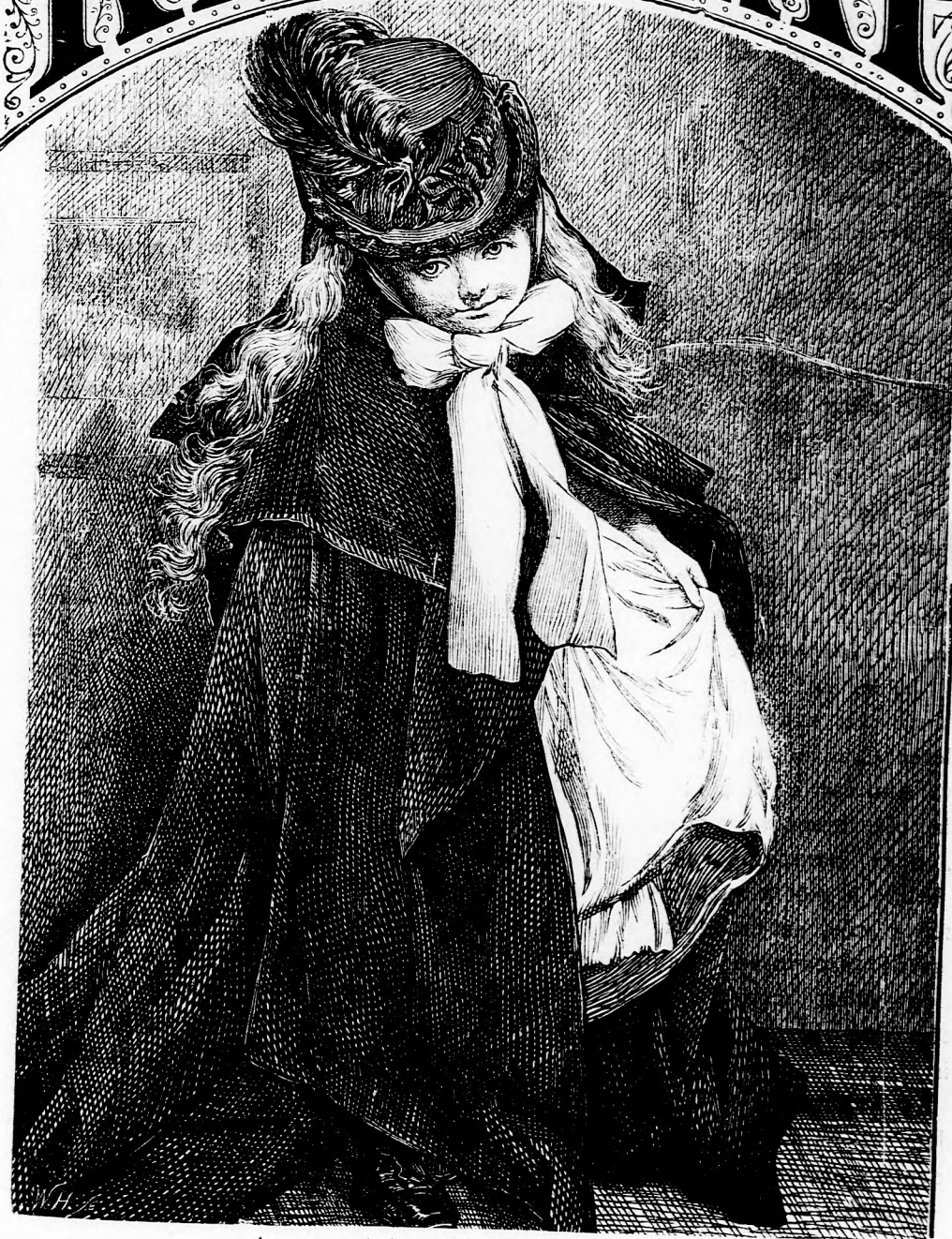
ARANKA SÉTÁLNI INDUL. (Lásd a 138. l.)