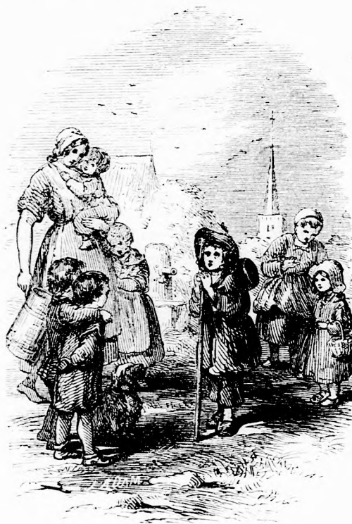
A KIS VÁNDOR. (Lásd a 143. l.)