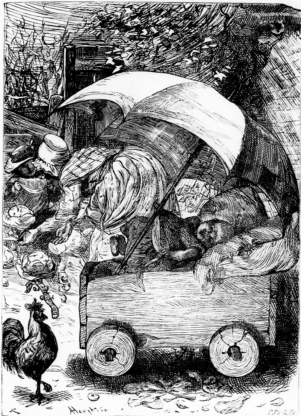
ÁRNYÉKBAN (Lásd a 139. l.)