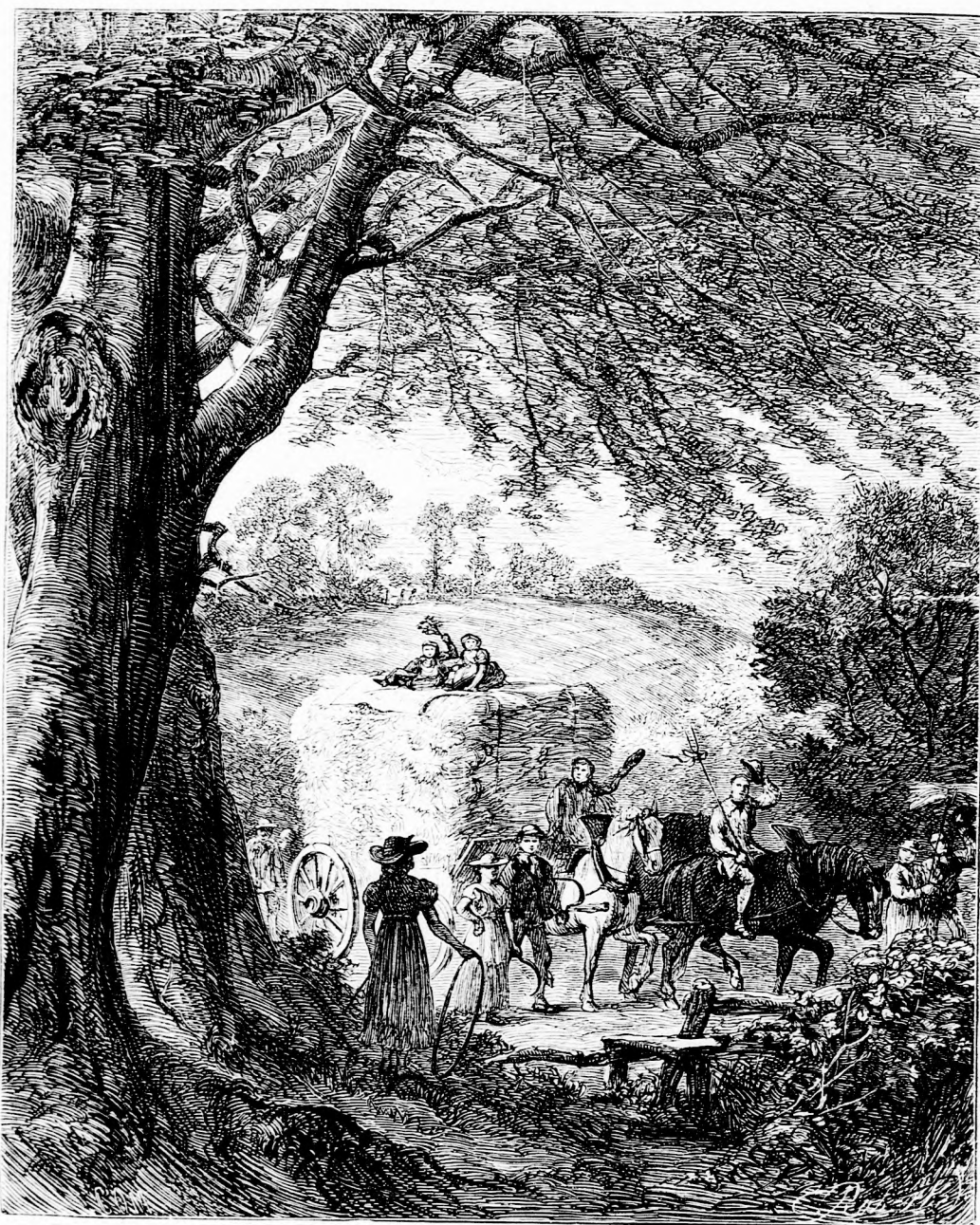
BUZATAKARITÁS. (Lásd a 270. l.)

Felelős szerkesztő: Forgó bácsi . Kiadó-hivatal: Budapest, bálvány-utca 9. sz. Nyomatott Deutsch testvérek könyv- és könyomdai műintézetében Budapesten. Ára negyedévre 1 frt. 20 kr. Megjelen hetenként egyszer 16 oldalon.