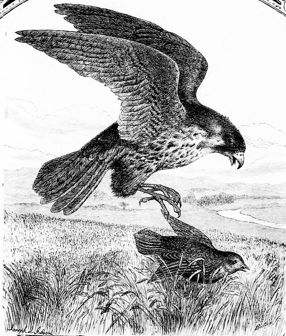
A VÉRCSE ÉS A VERÉB. (Lásd a 270. l.)