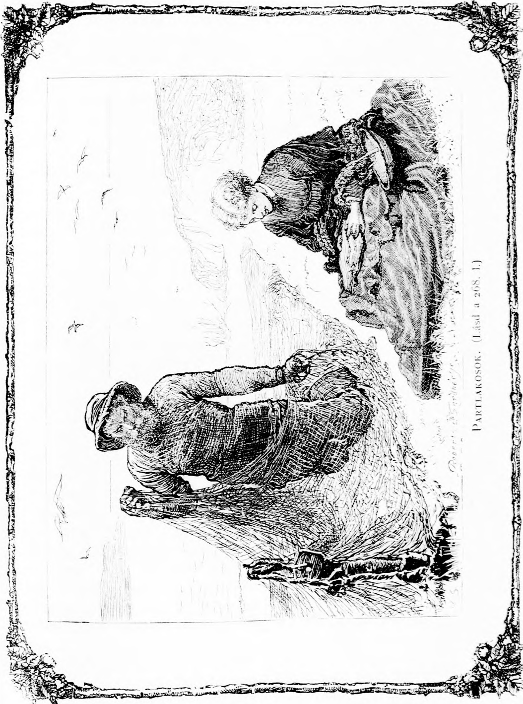
PARTLAKOSOK. (Lásd a 268. l.)