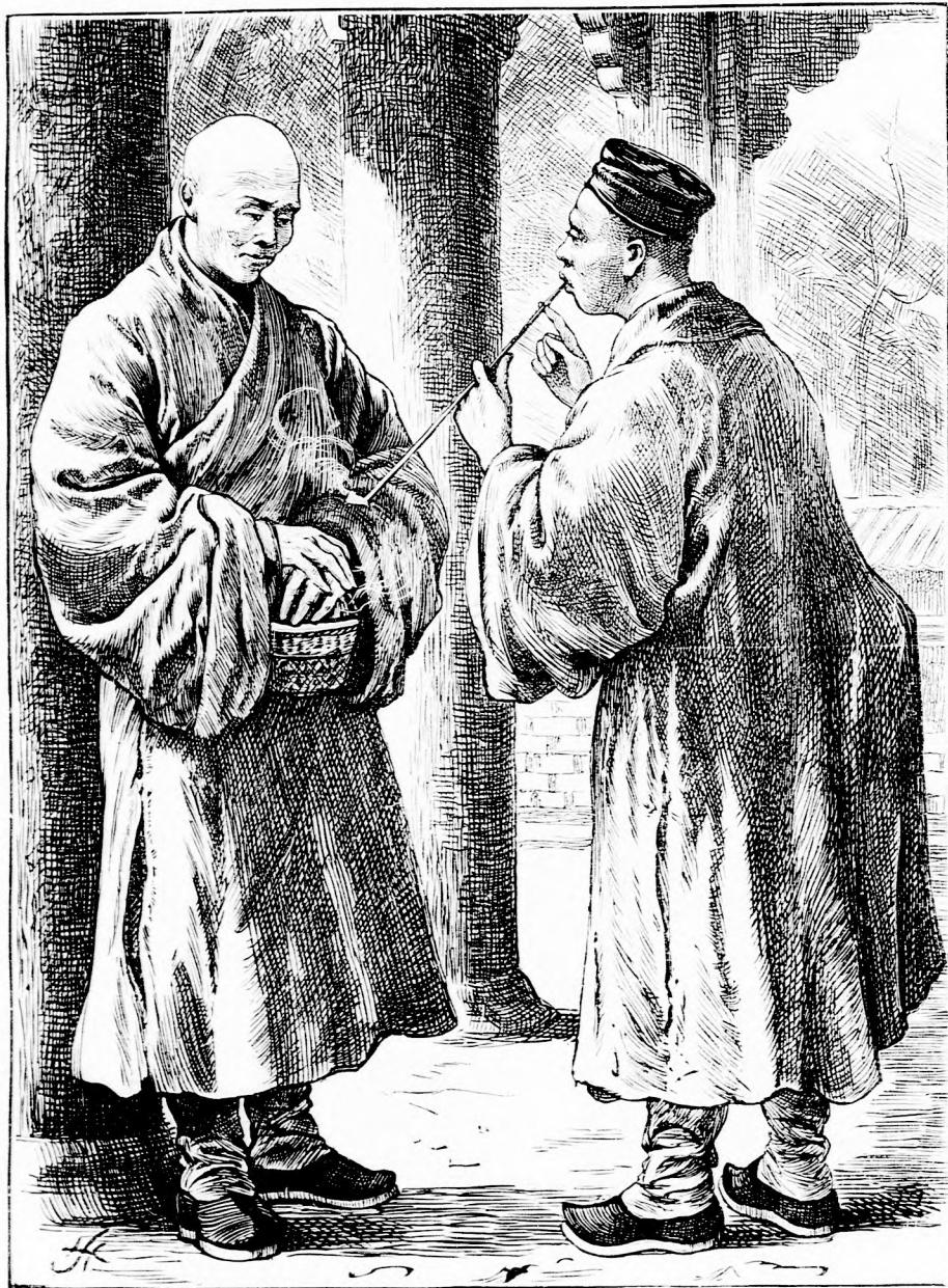
EGY PIPÁCSKA OPIUM. (Lásd a 269. l.)